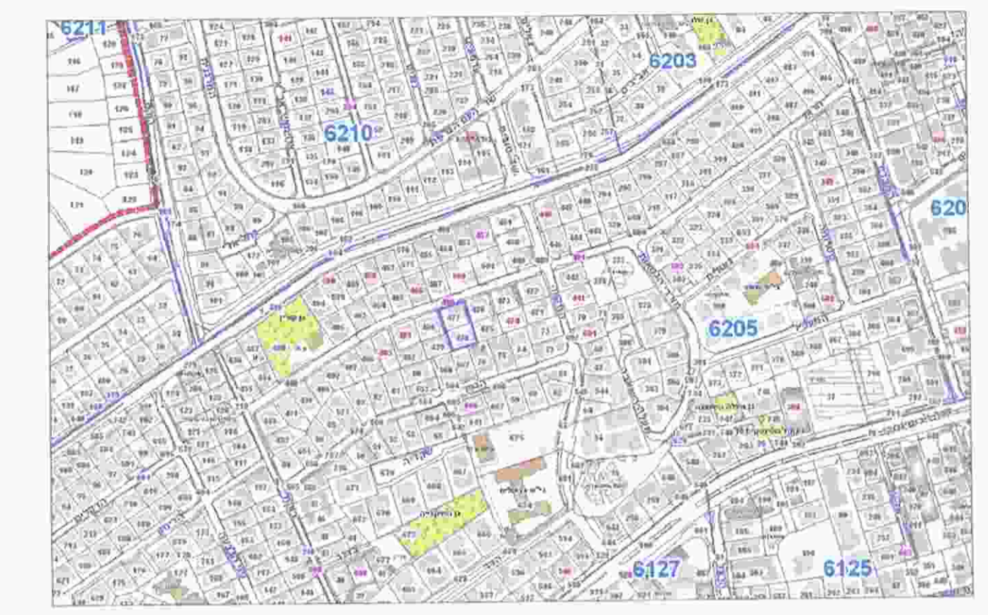
תרשים התמצאות קנ"מ 1:5000

15. 2. 13 1506-0350736 אדריכלות והנדסת בנין בע"מ מועלים אדריכלות והנדסת בנין בע"מ רח' סיריז 13 בעתים תל: 03-6050847, פקס: 03-6020590