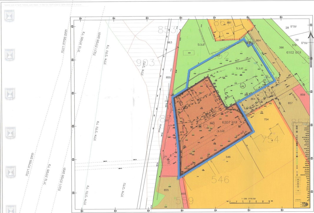
תכנית מצב מאושר קנ"מ 1:500