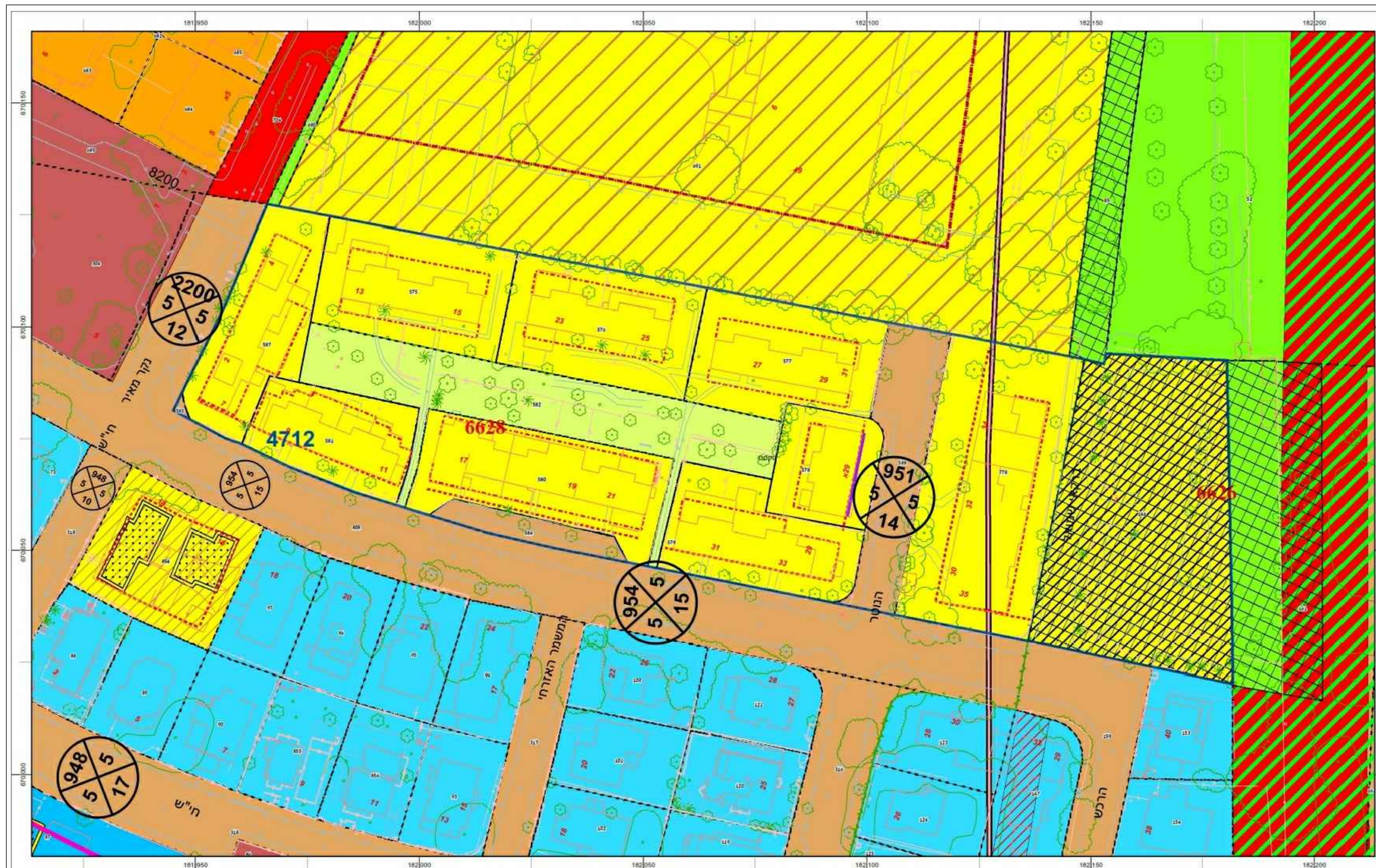
עריכת תל אביב - יפו / אגף התכנון / מרכז יעור ליריע הגדול