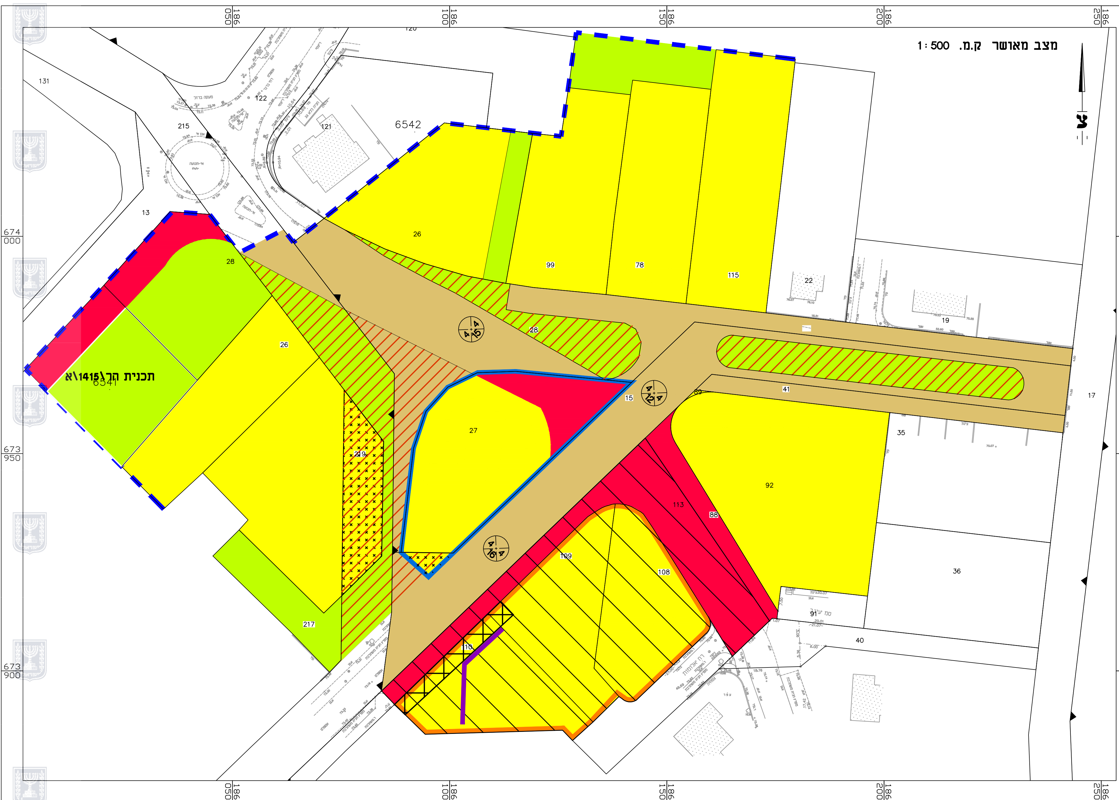
מצב מאושר ק.מ. 1:500