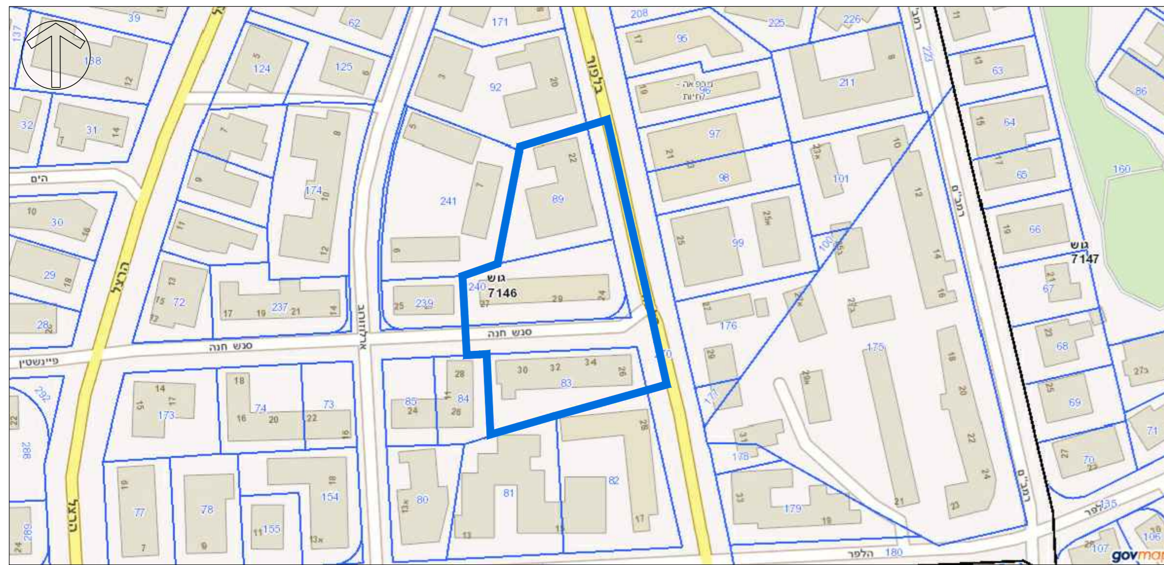
תרשים סביבה קנ"מ 1:250