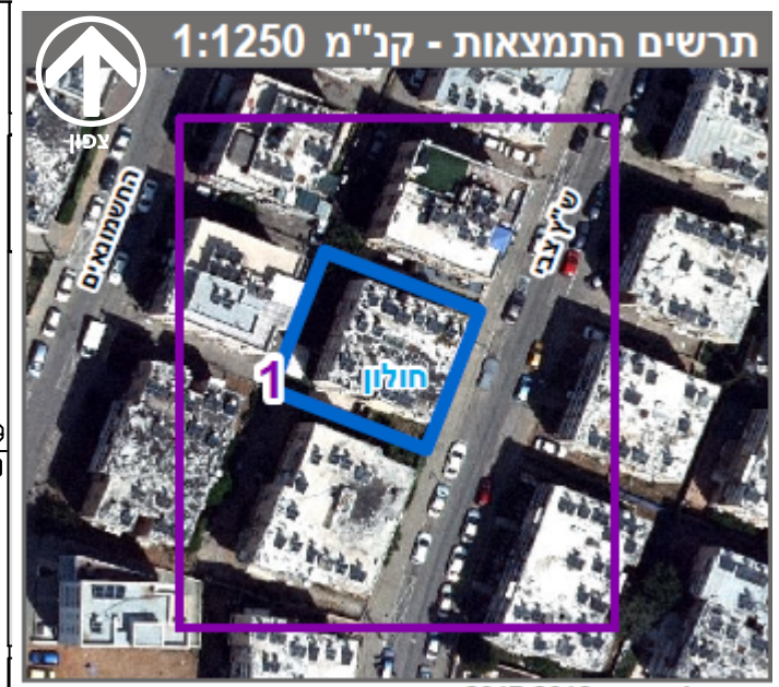
שנת צילום אוויר: 2017-2018