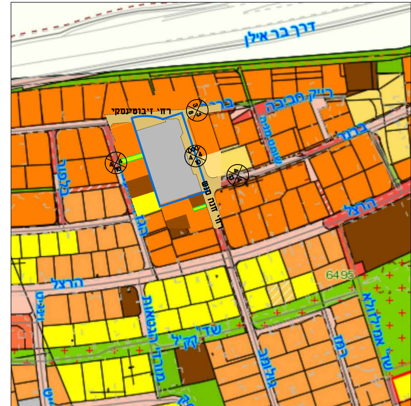
מפת סביבה קניי 1 : 2500