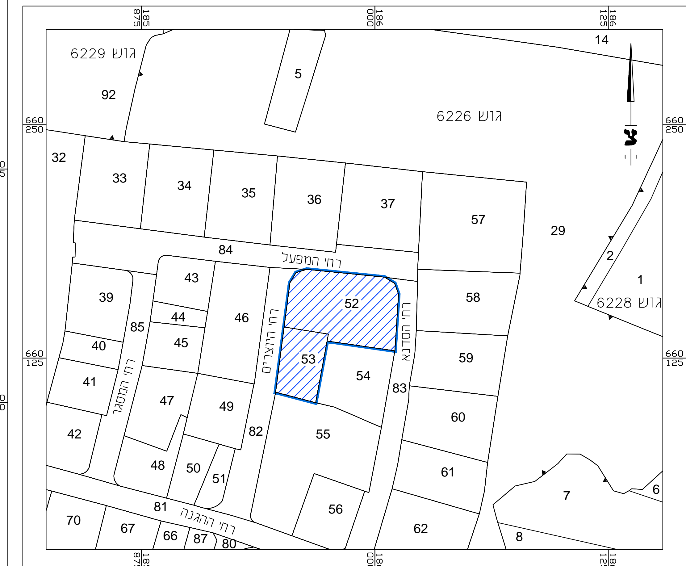
ק.מ. 1 : 1250 תרשים סביבה