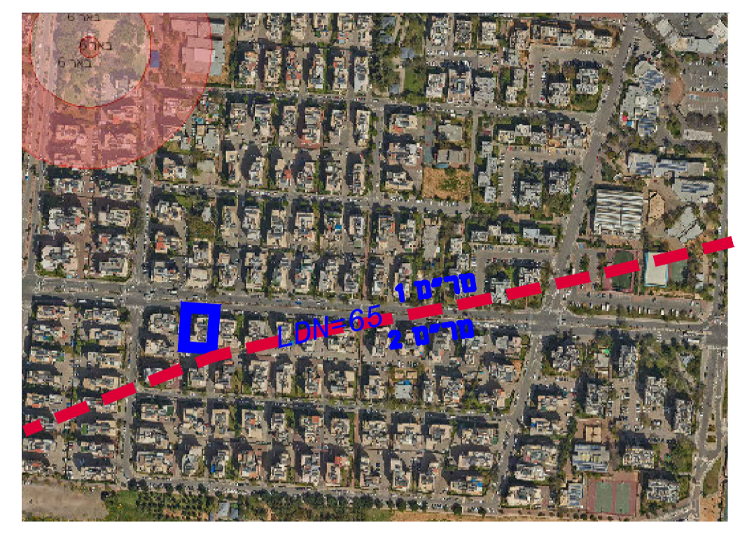
תרשים התמצאות קנ"מ 1:5000