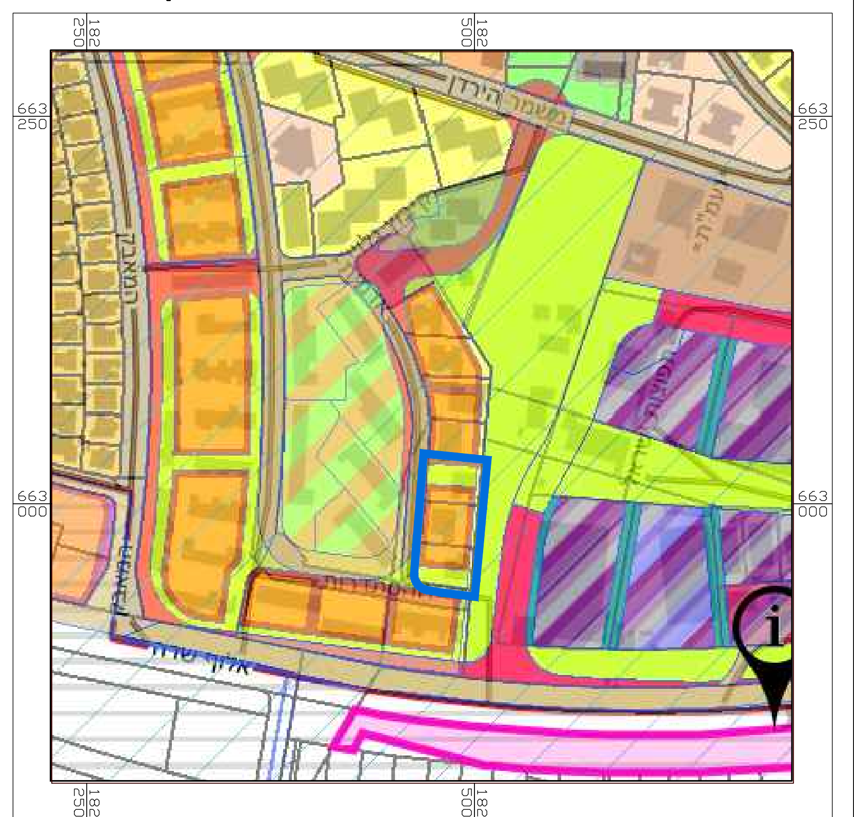
תרשים סביבה קני"מ: 1:2,500