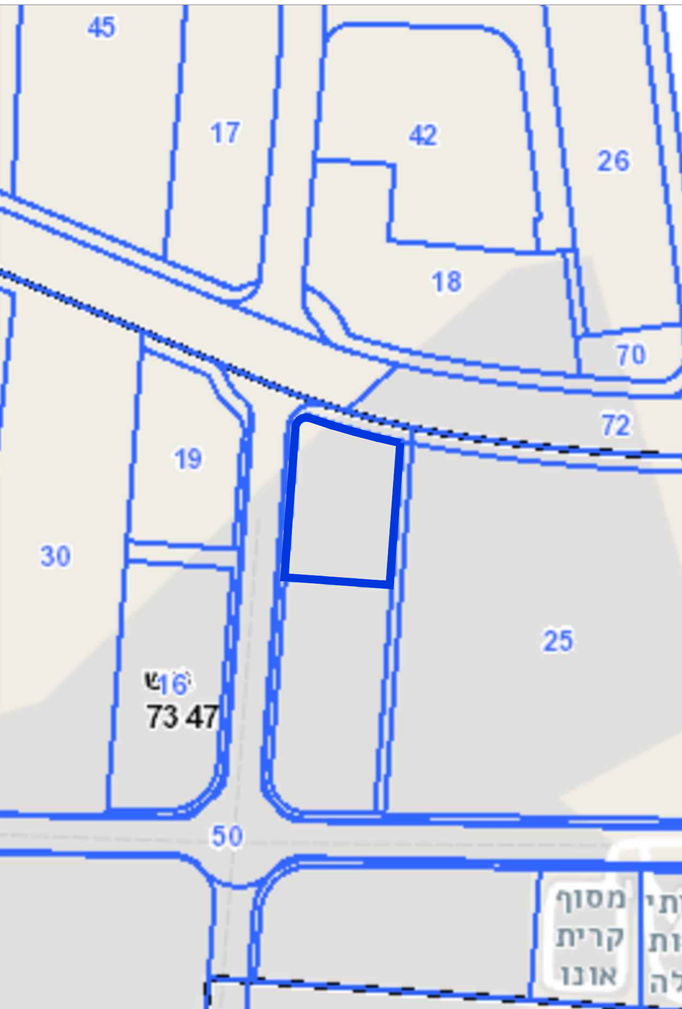
תכנית סביבה 1:2000