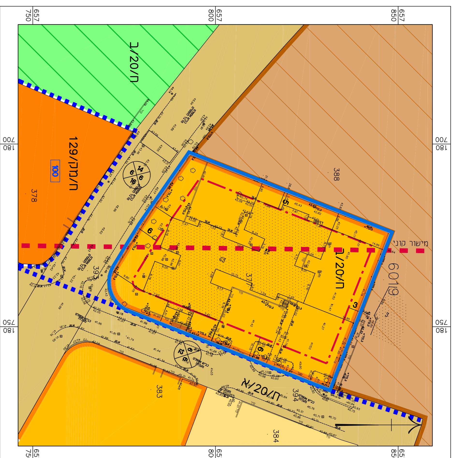
תצב מאושר קני"מ 1:500