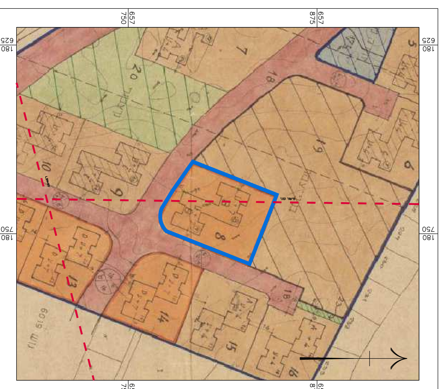
תרשימים סביבה קני"מ 1:1250