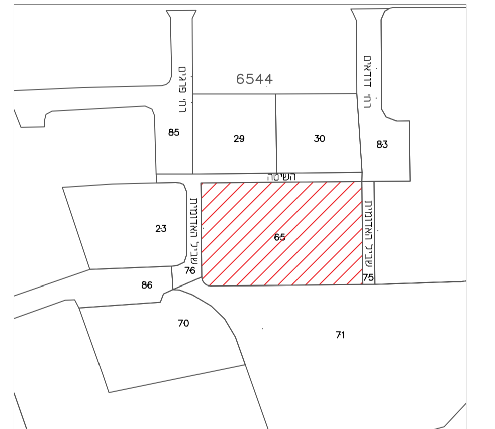
תרשים סביבה 1:1250