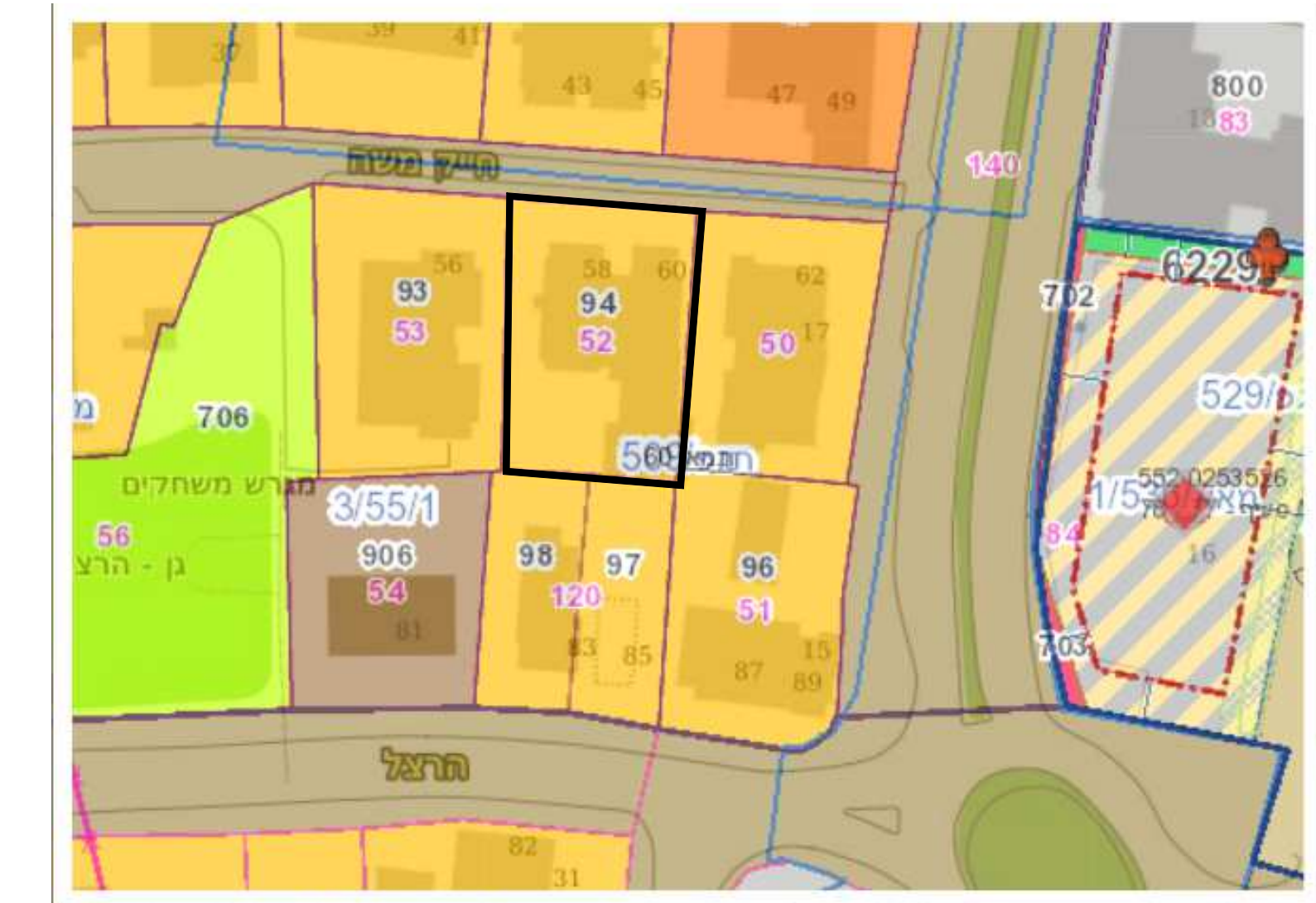
תרשים ייעודי קרקע עפ"י GIS