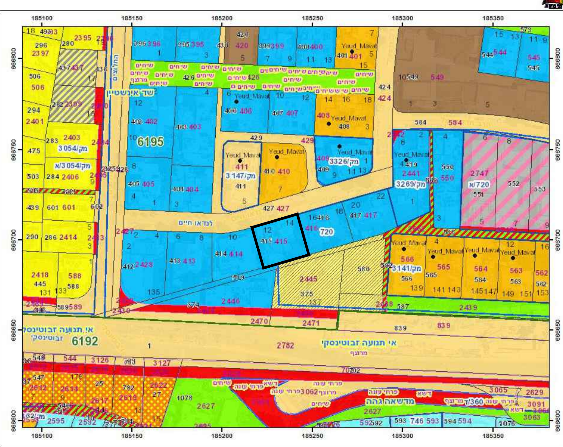
June 22, 2023 קנה מידה: 1:1,250