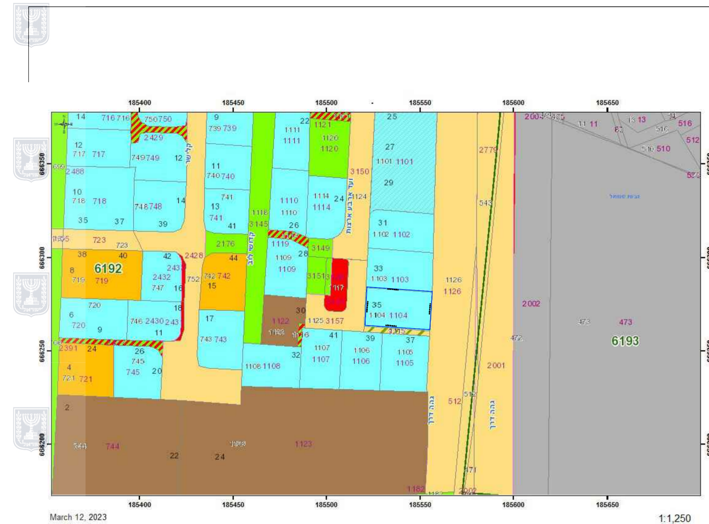
תרשים סביבה קנ"מ 1:1250