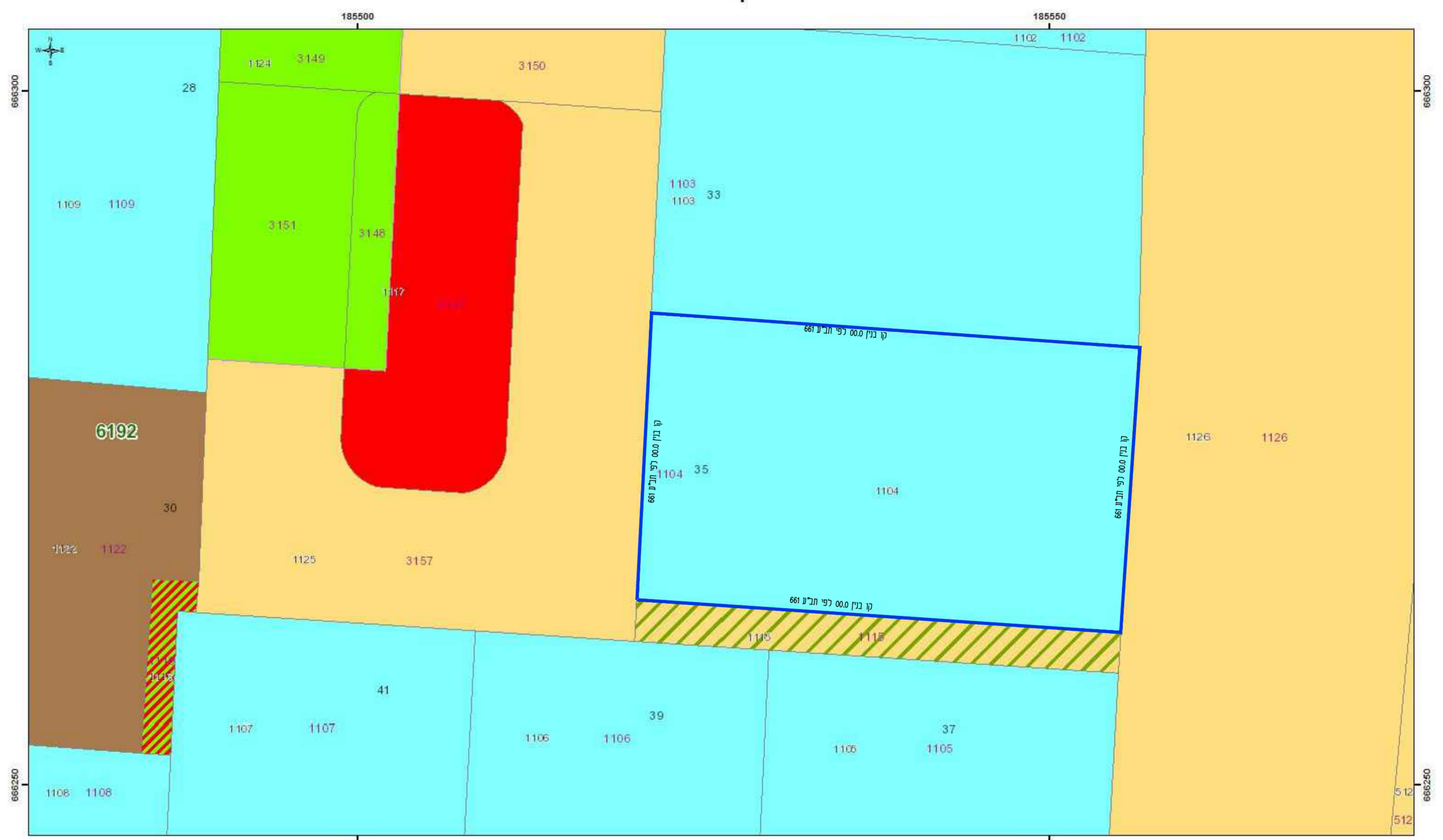
תשריט מצב מאושר קנ"מ 1:250