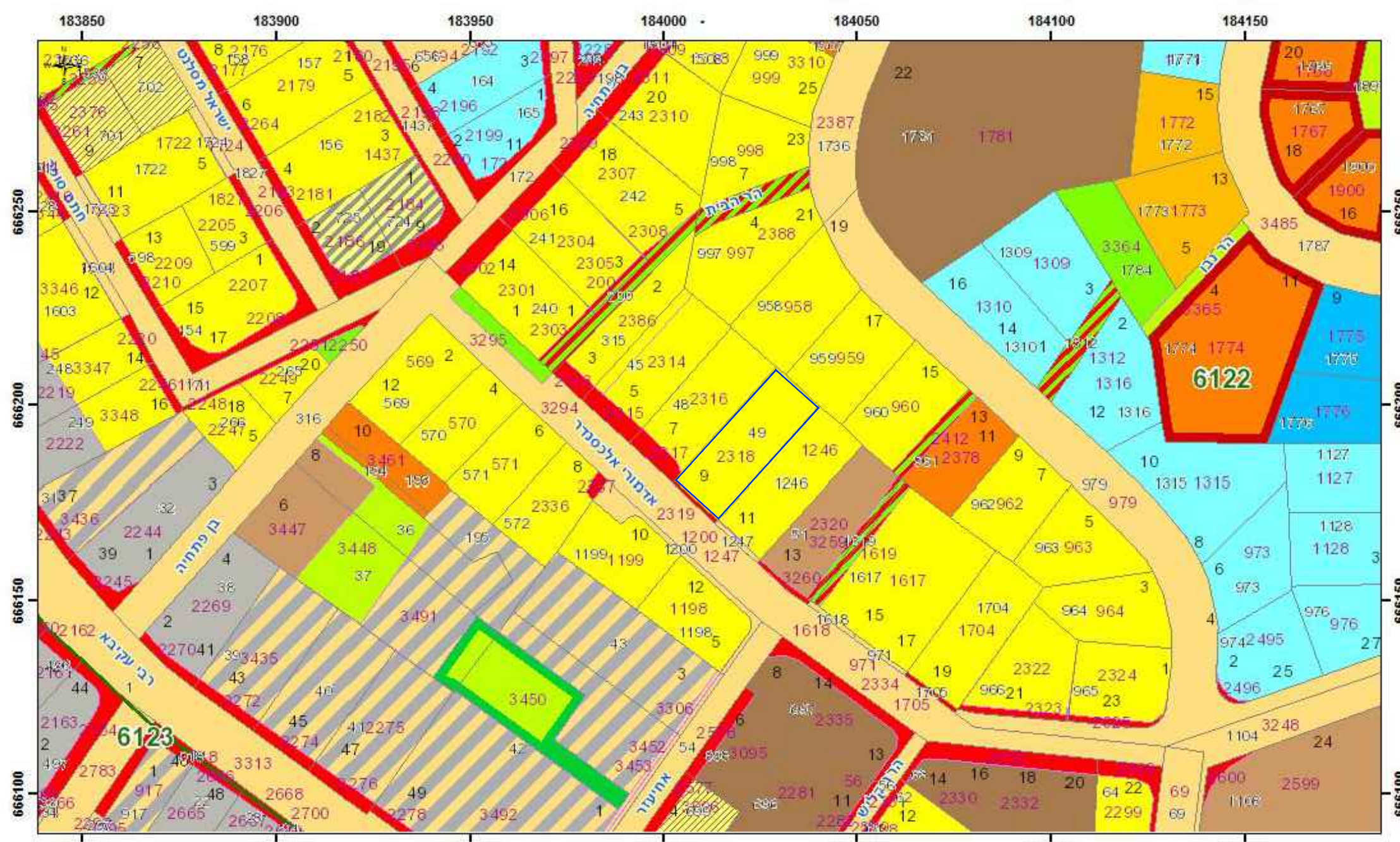
תרשים סביב לפי תוכנית המתאר הכוללת 501-0308296 June 22, 2022 יעודי קרקע שטח ציבורי פתוח מגורים ב שביל הולכי רגל מגרש מיוחד יעודי מבאת מגורים ג מגורים א שטח פרטי פתוח מגורים ומסחר מגורים ג מגורים ב מגורים ב1 מגורים מגורים ד מגורים מגורים ומסחר מבנים ומוסדות ציבור מגורים ג מגורים ב מגורים ג ח. מסחרית מגורים מגורים מגורים מגורים ומסחר מגורים ומסחר מגורים ג מגורים ב מגורים ג ח. מסחרית מגורים מגורים מגורים מגורים ומסחר