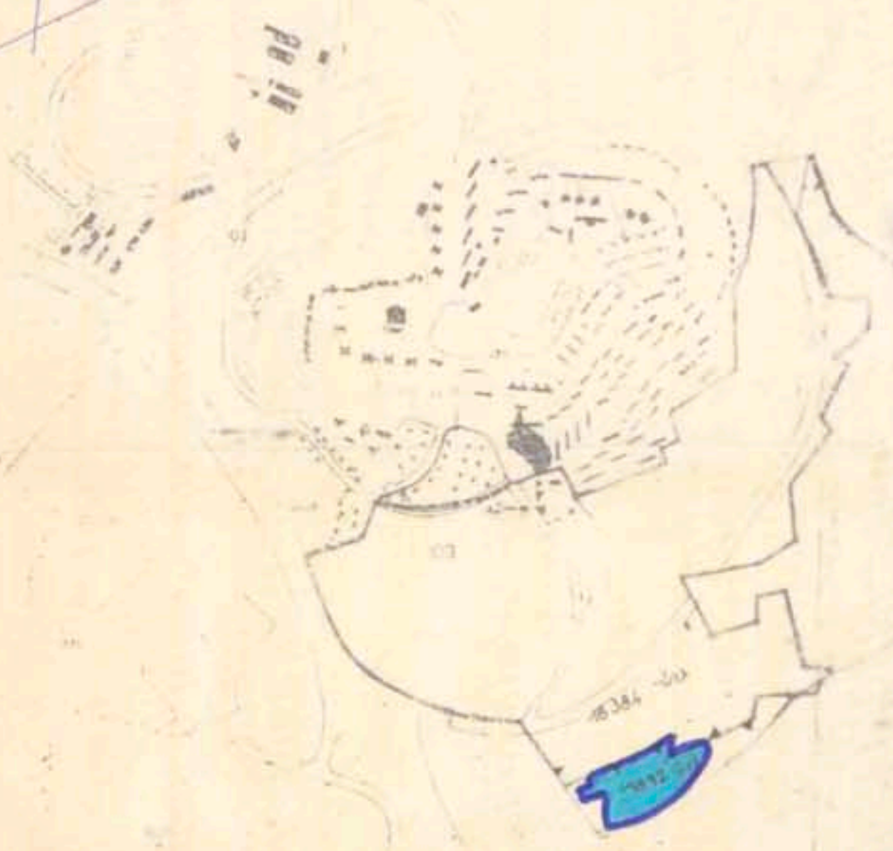
תרשים הסביבה 1:10000

חתימות: מחבר התכנית: מניש התכנית: בעל הקרקע: תאריך: