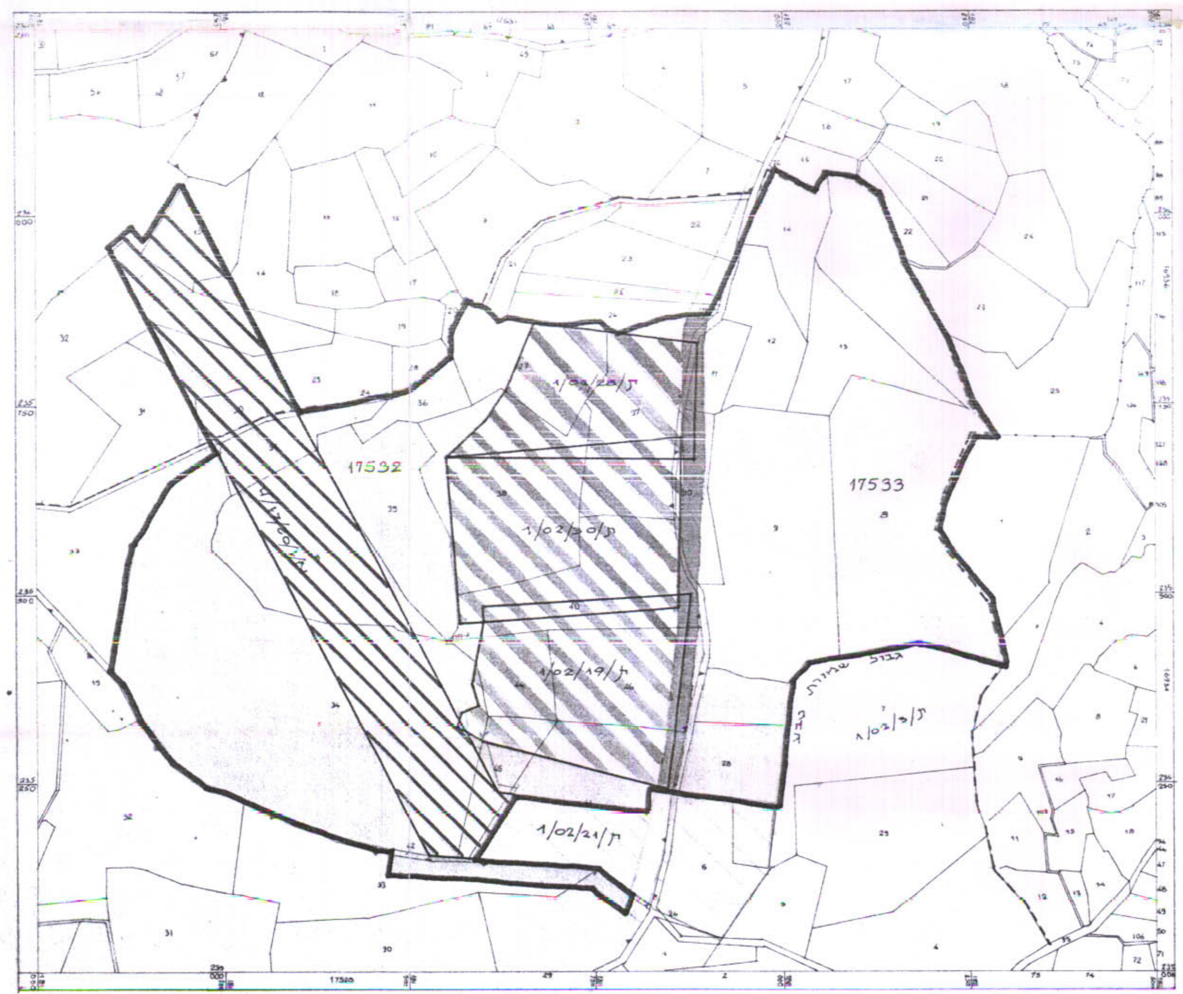
ק.ת. 1:5000 תרשים מאב קיים

חתימת היוזם והמגיש ש.בר-טוב אדריכל חתימת בעל הקרקע חתימת המתכנן ש.בר-טוב אדריכל חותמות האישור