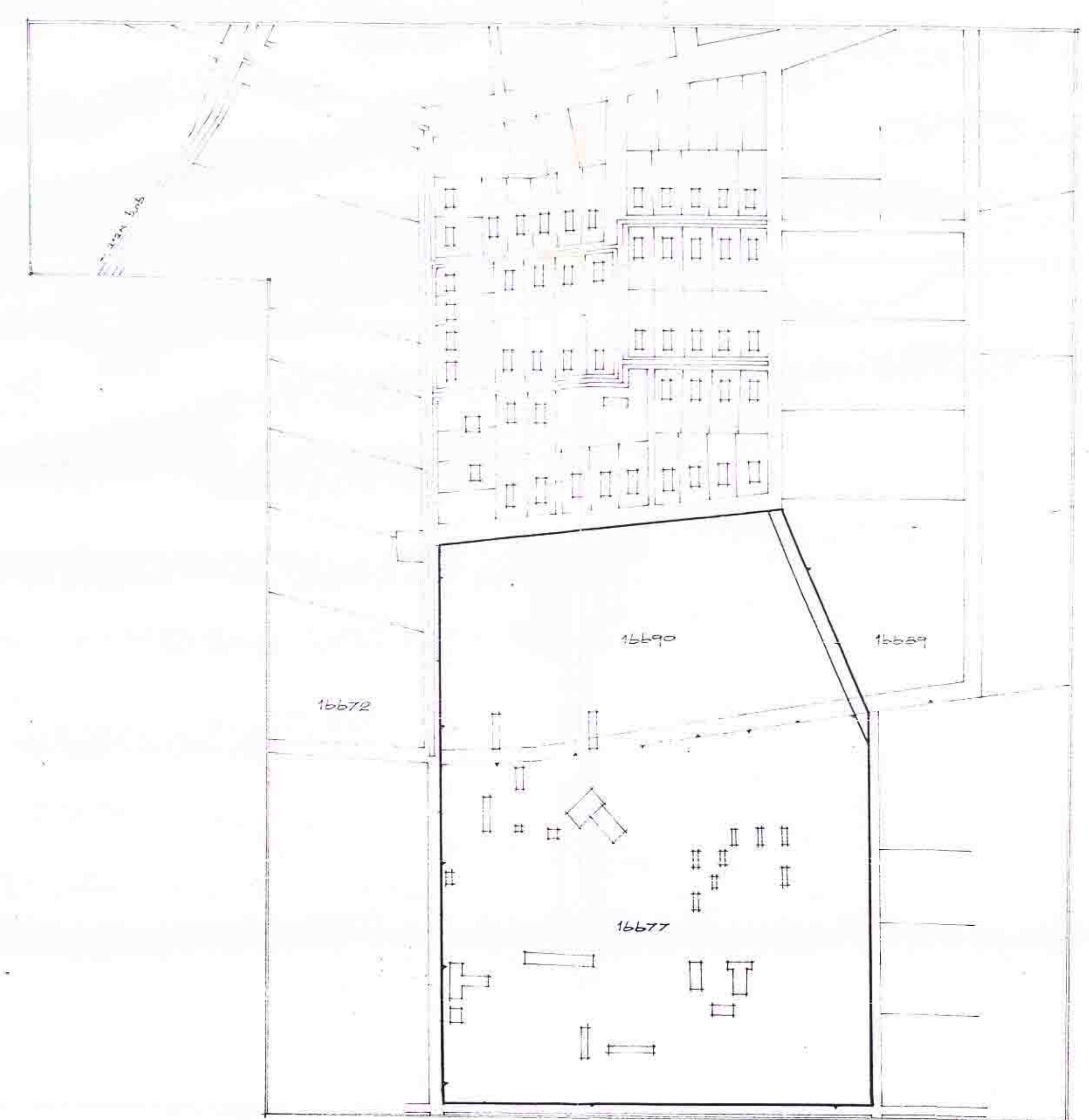
תרשים הסכמתי 1:2500

תחית בעל הקרקע: תחית מיוצג: תחית המתכנן: משרד התכנון והבנייה