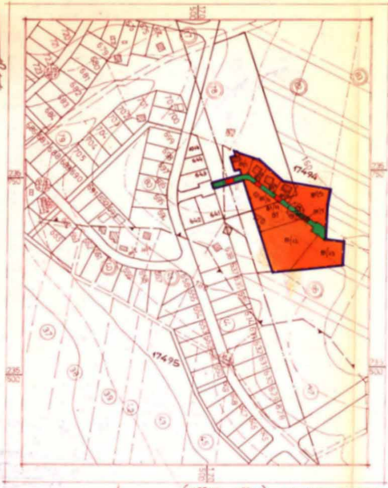
תרשים הסביבה (מצב מוצע)