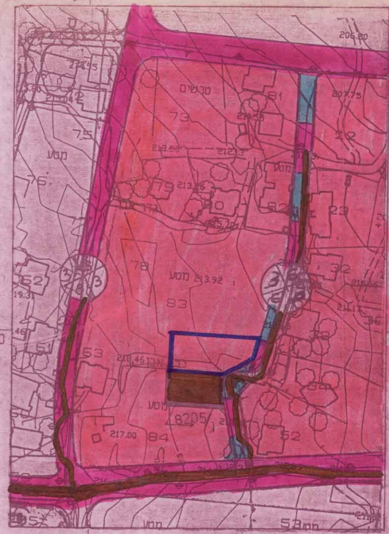
תכנית מצב מוצע 1:1250