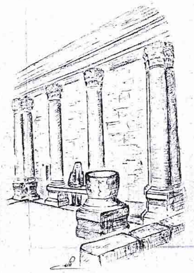
שחזור ארכיטקטוני-פונקציונלי של בית הכנסת בכפר נחום

מ"מ מס 606 מורכבת-למחן תוקף ב"ע מס 1307 מס 115