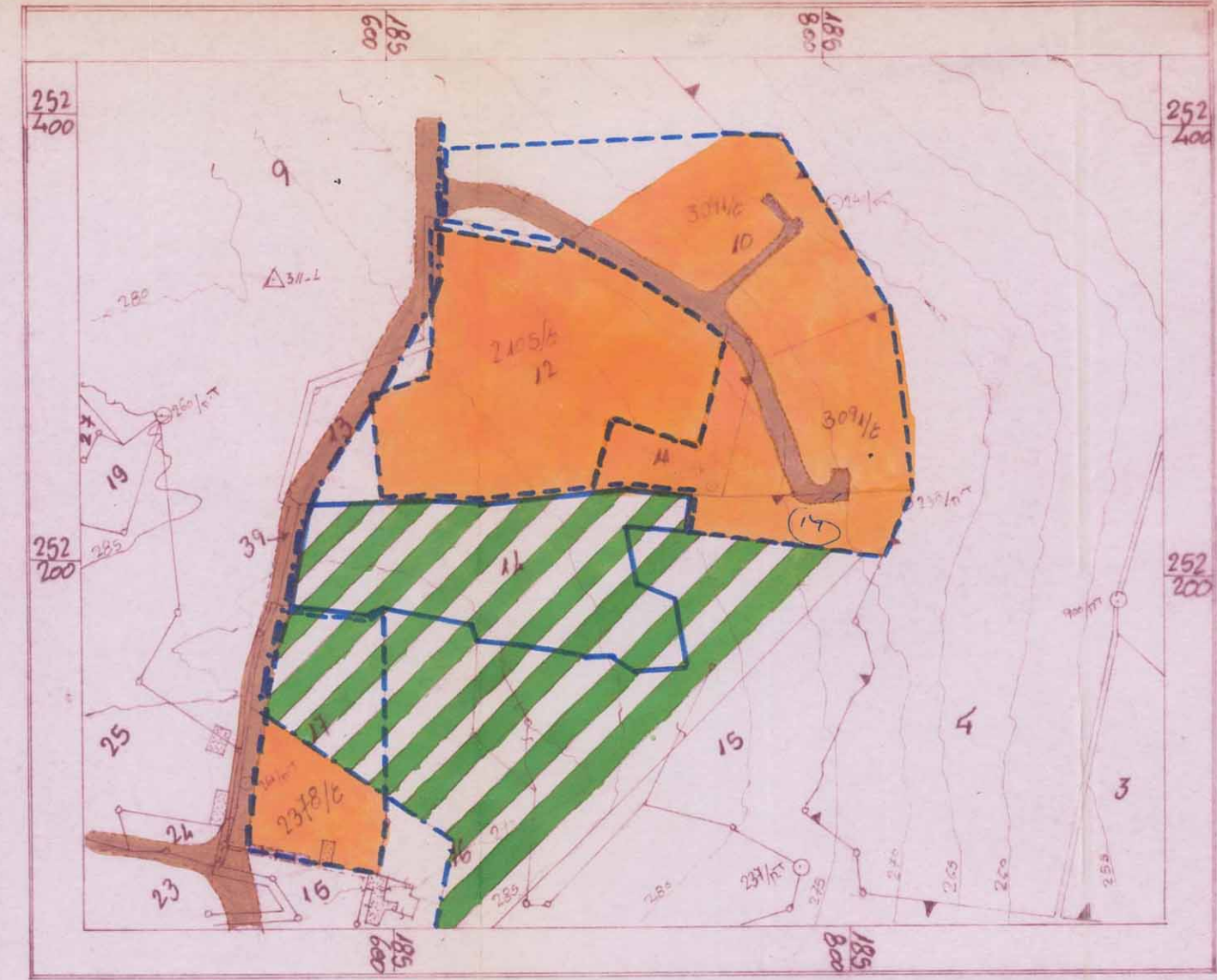
גרשים הסביבה ק"פ 1:2500 מצב ק"מ