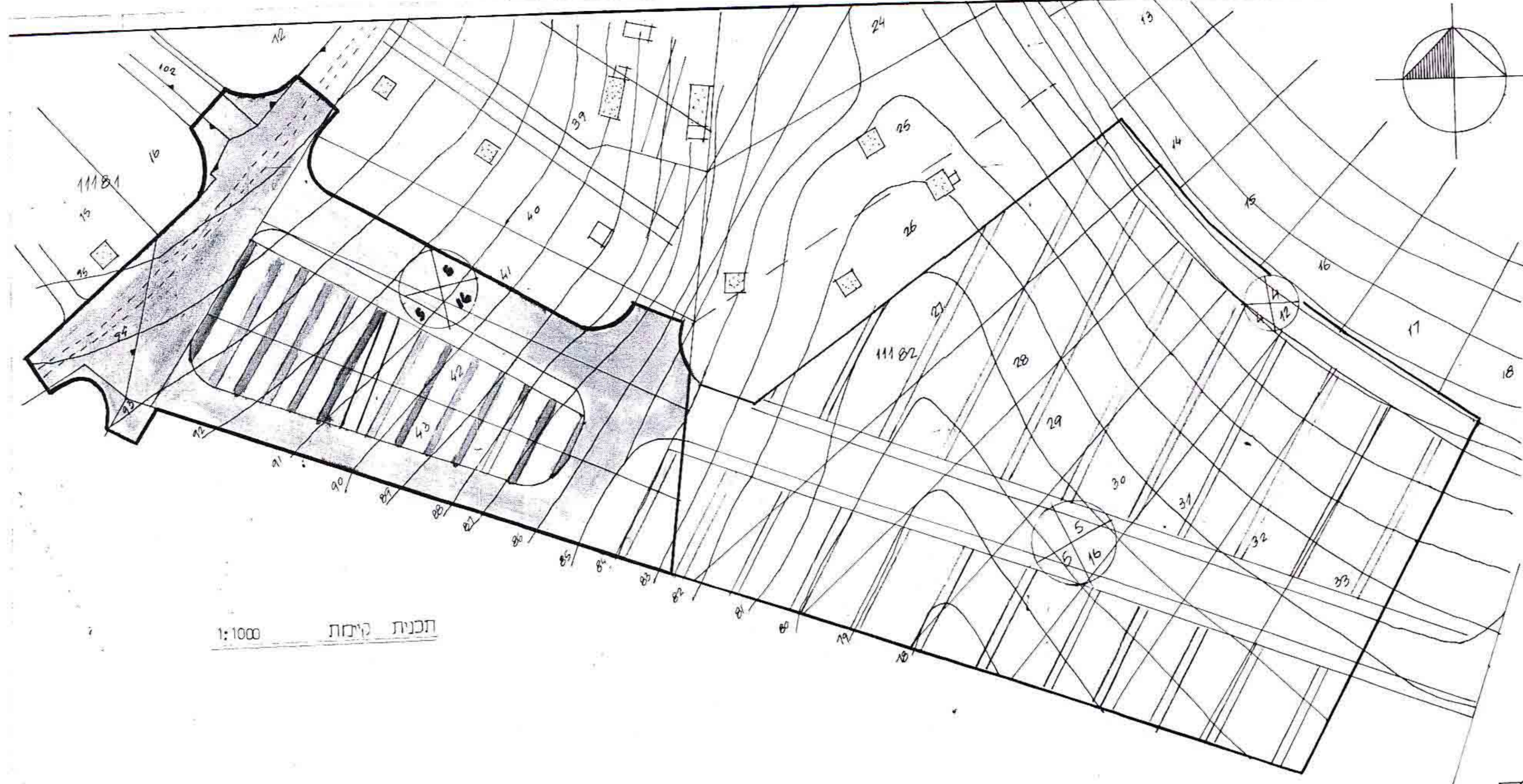
תכנית קיימת 1:1000

מסדר הערים חוק התכנון והבניה תשכ"ה-1965 מחוז 11832 מרחב התכנון מקומי תכנית מס' 5788 הועדה המחוזית לבנייה מיום 23/11/87 לחברת התקלה מט מנהל כלל