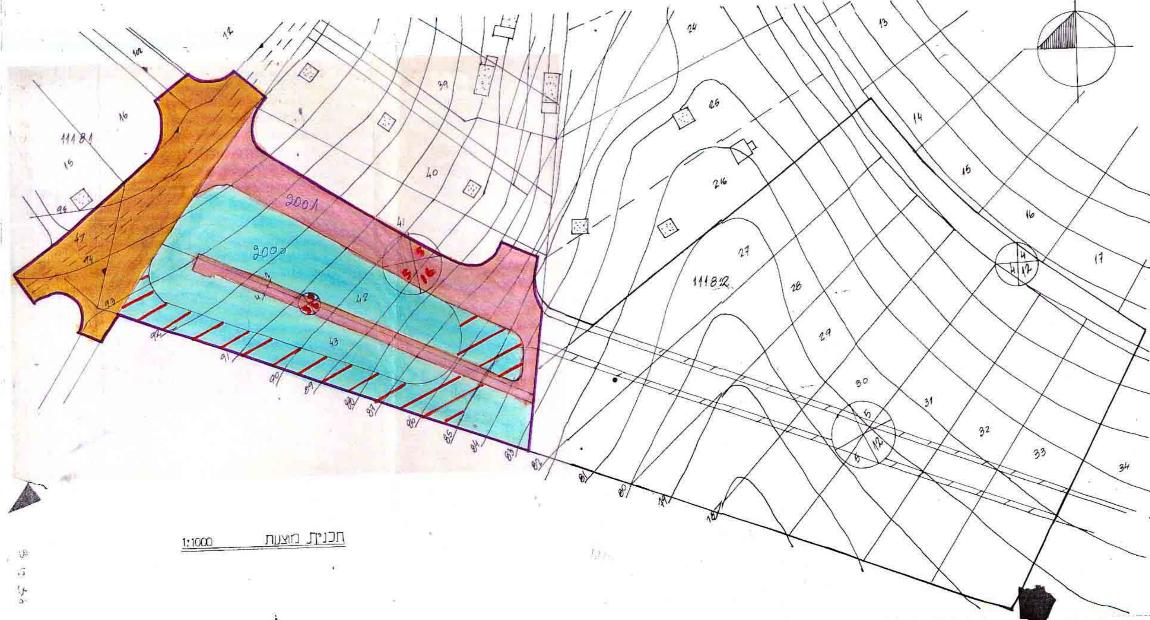
תכנית חוצצת 1:1000