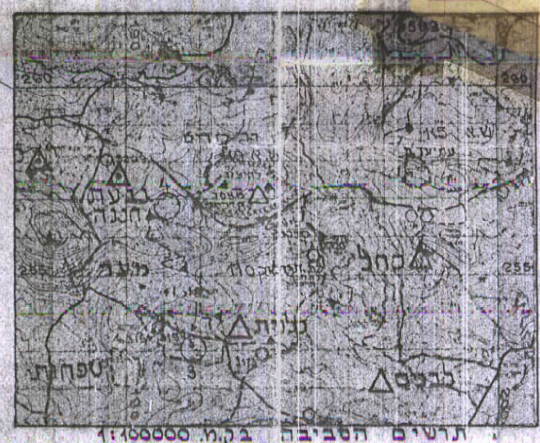
תרשים הטבייה בק.מ. 1:100000

מועצה אזורית עמק הירדן פקודה בנין ערים 1965 ועדה מקומית רבנייה ותכנון ערים עמק הירדן תכנית מס' 4529/א הועדה המחוזית לביניה ותכנון עם הצלחה לטובת העדה סגן מנהל כללי לחכ"מ יושב ראש העדה