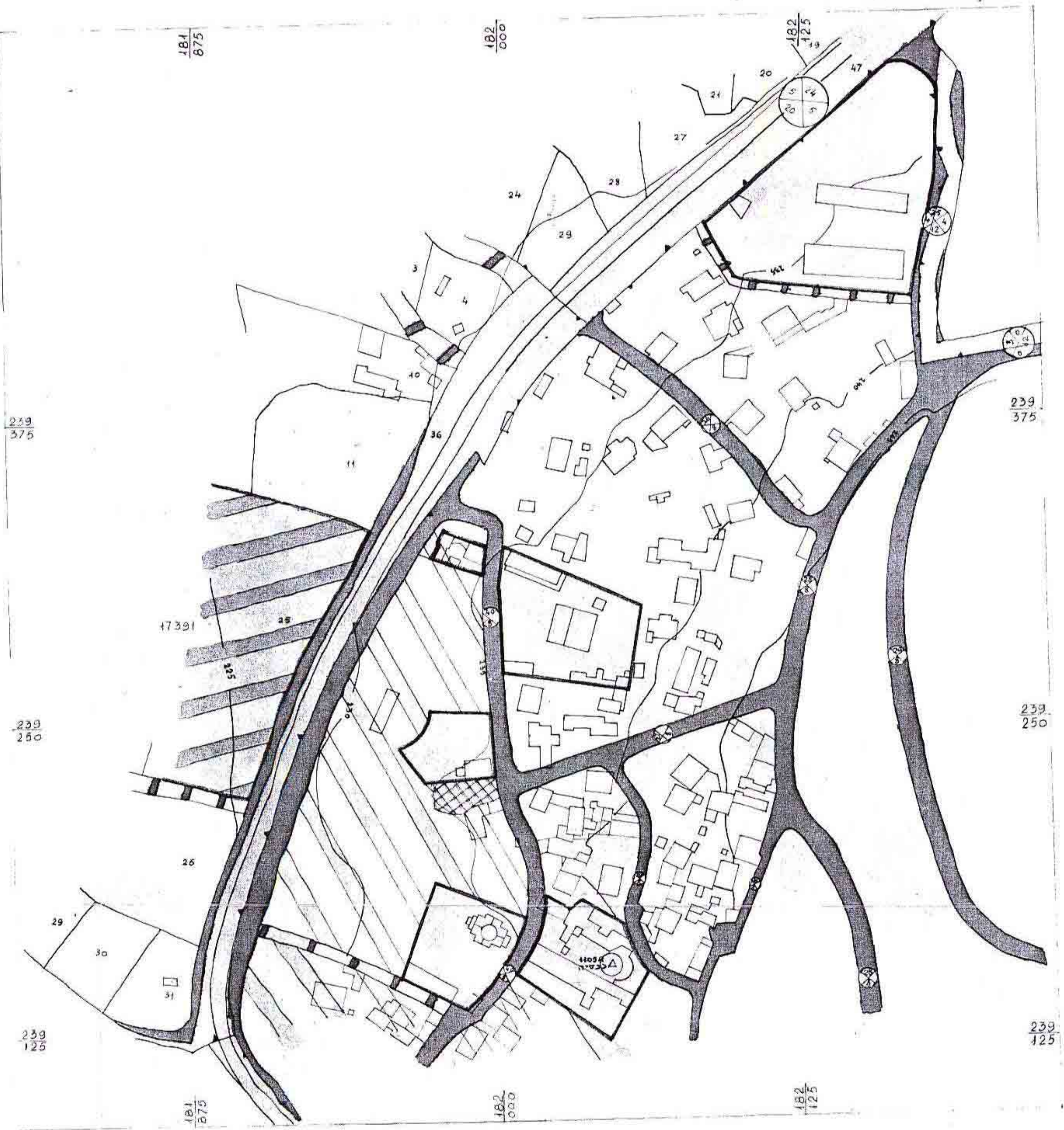
תכנית מארג קיים ק"מ 1:1250