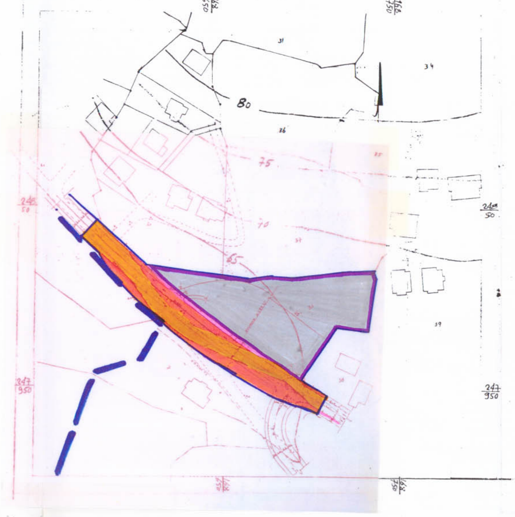
תכנית סביבה מוצעת ק"מ 1:1250

מחוז הצפון ע"פ ע"מ התקום א'עב"ז גוש 12202 חלקה 30 הוכן ע"ד נשאשיבי ז"ל א' נשאשיבי קנה מידה 1:500