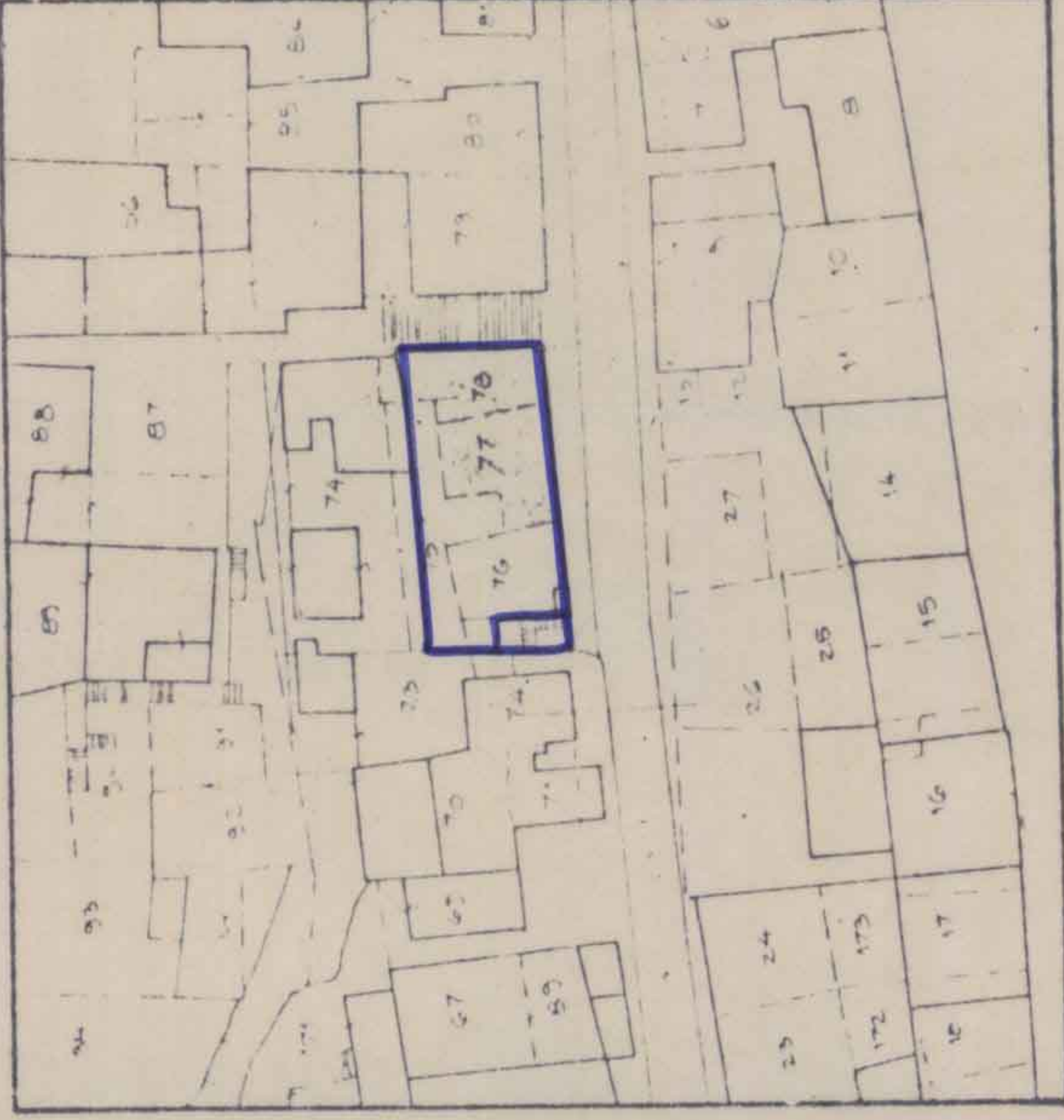
תרשים סביבה קנה 1:250

מרחב תכנון מקומי תפא תכנית תפא לשינוי ייעוד ק.ת. 1:200 7219/8