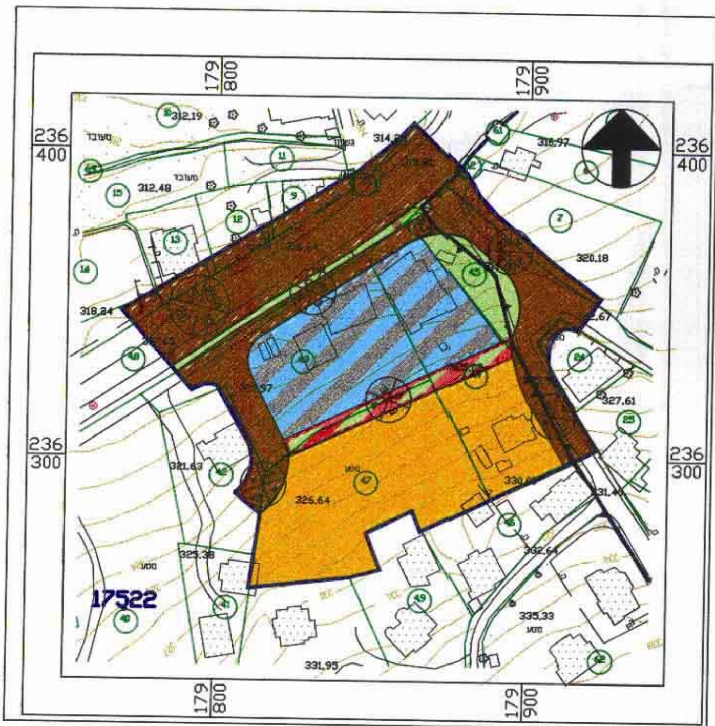
תכנית מצב קיים ק.מ. 1:1250

עורך התכנית מרעי מקדאד כפר משהד טל. 06-516624