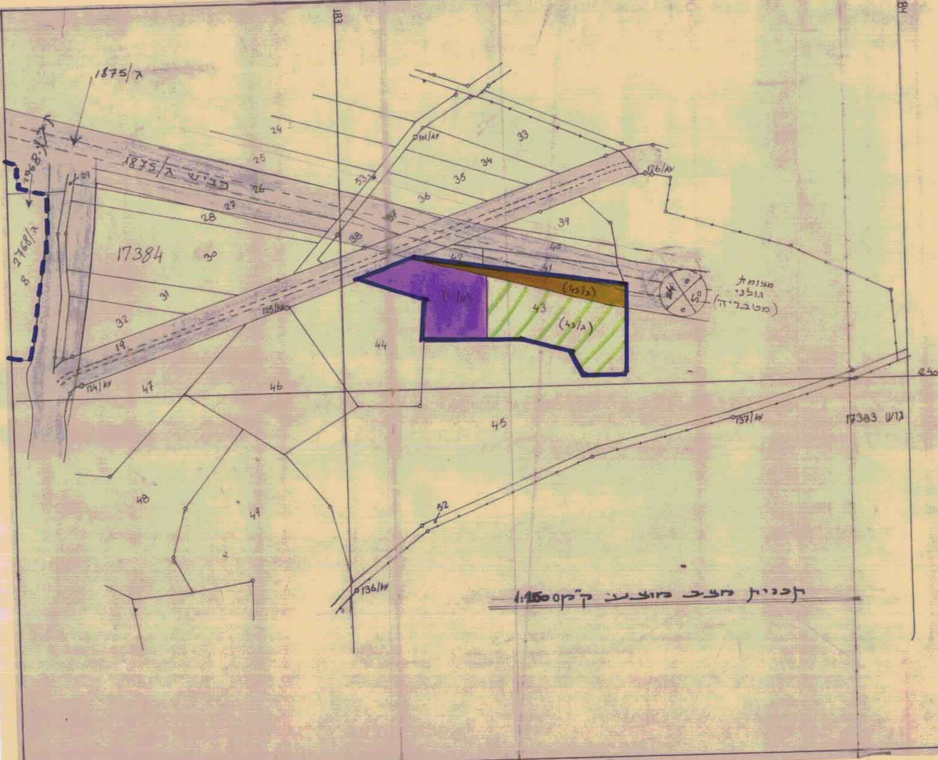
תכנית מצב מוצעת ק"מ 1:15000