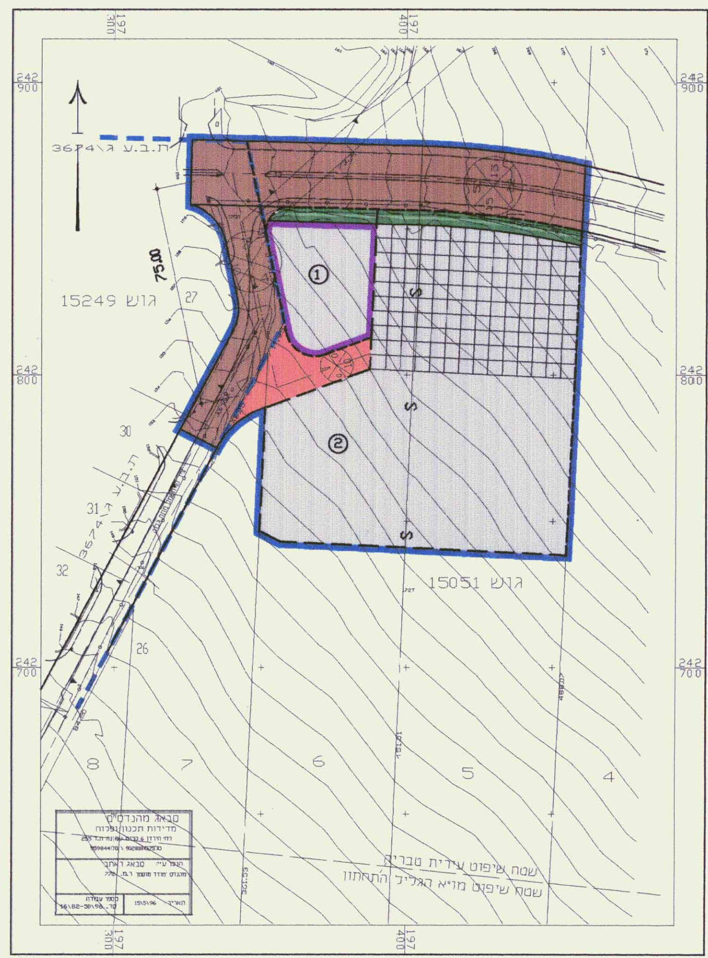
מצב מוצע קני"מ 1:1250