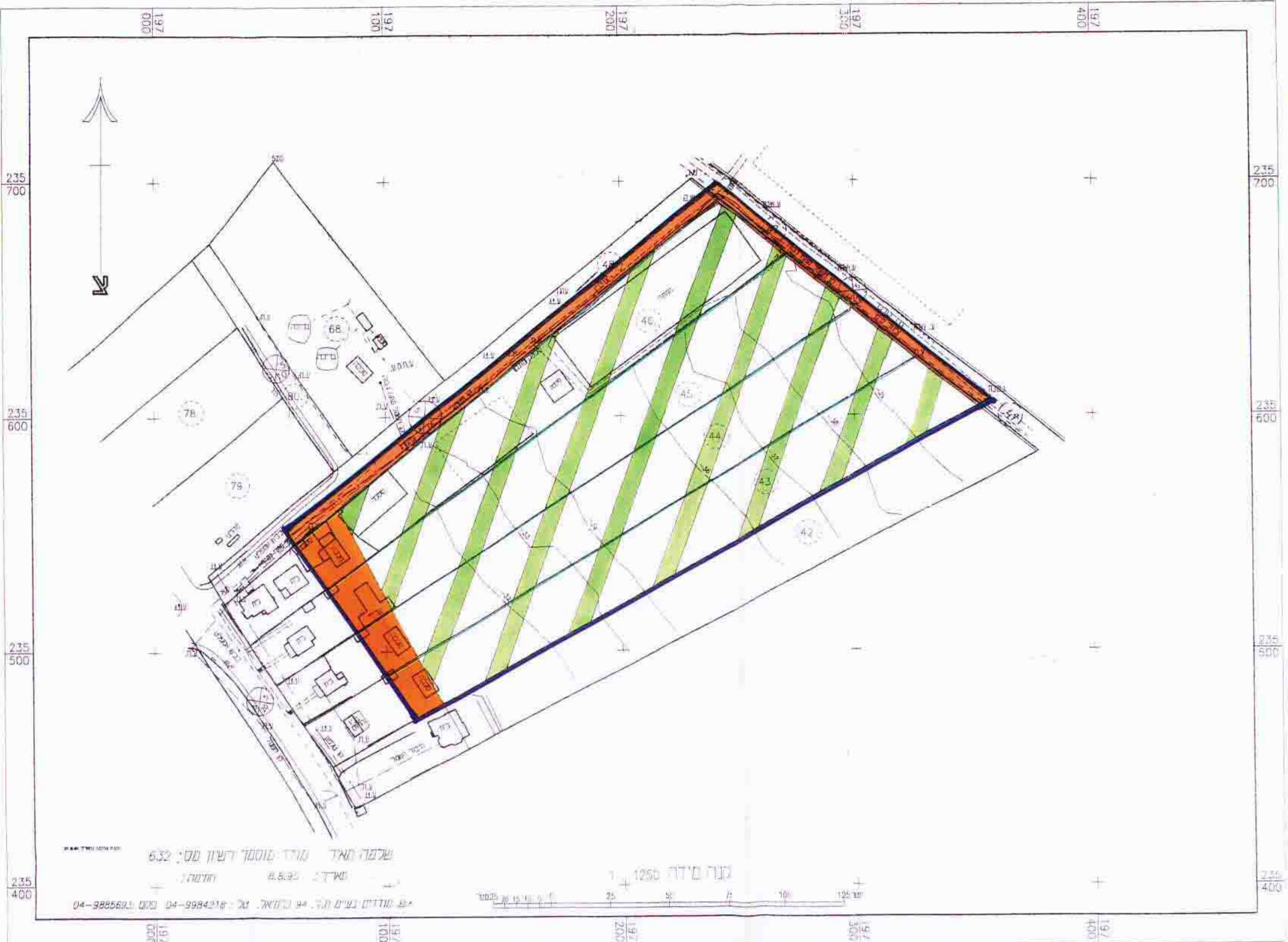
תכנית מצב קיים ק"מ 1:1250