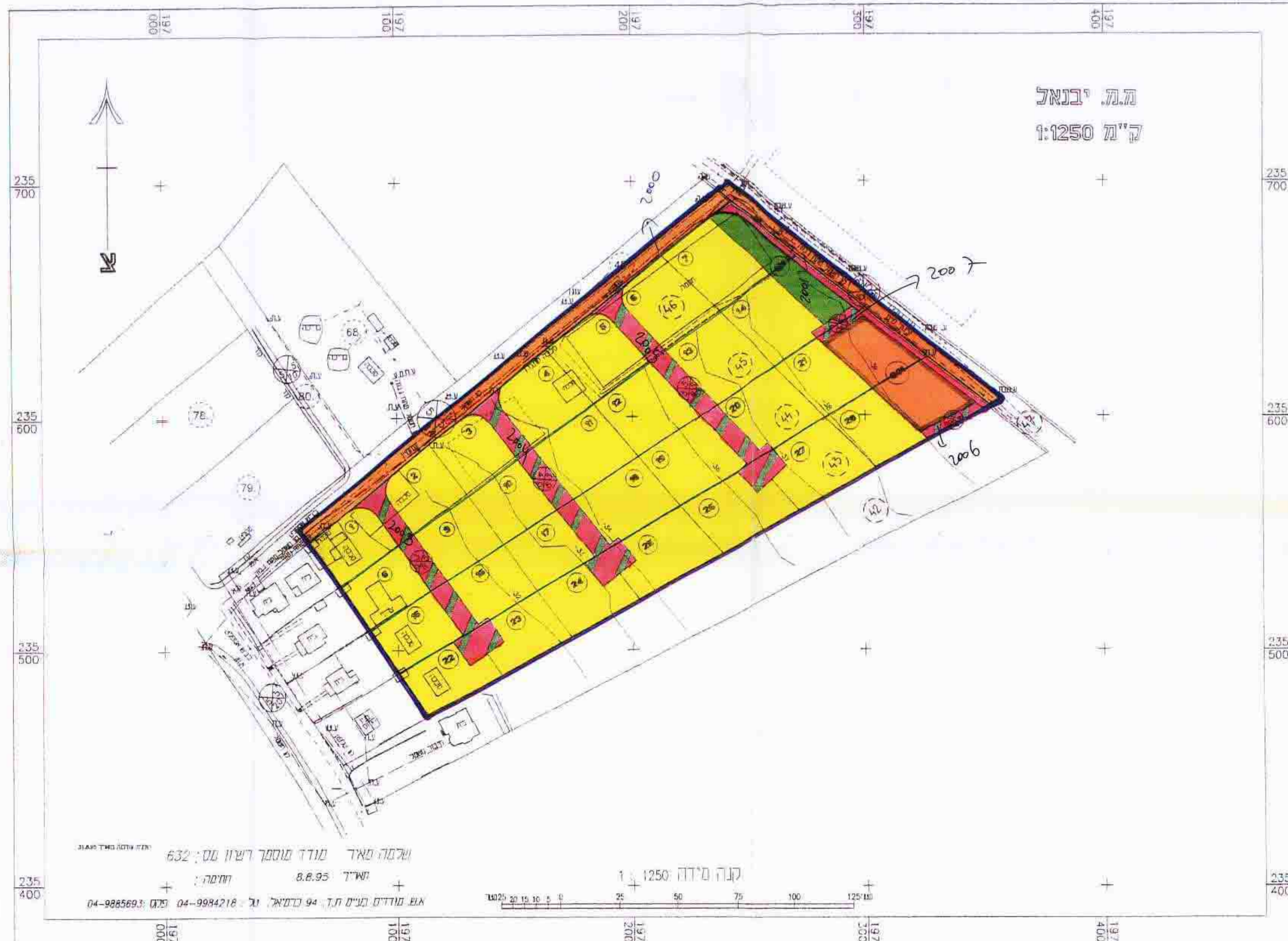
תכנית מצב מוצע ק"מ 1:1250