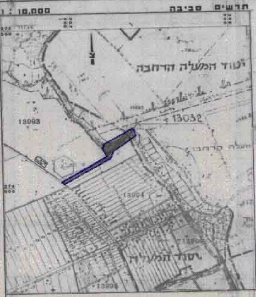
טבלת אזורים ושטחים