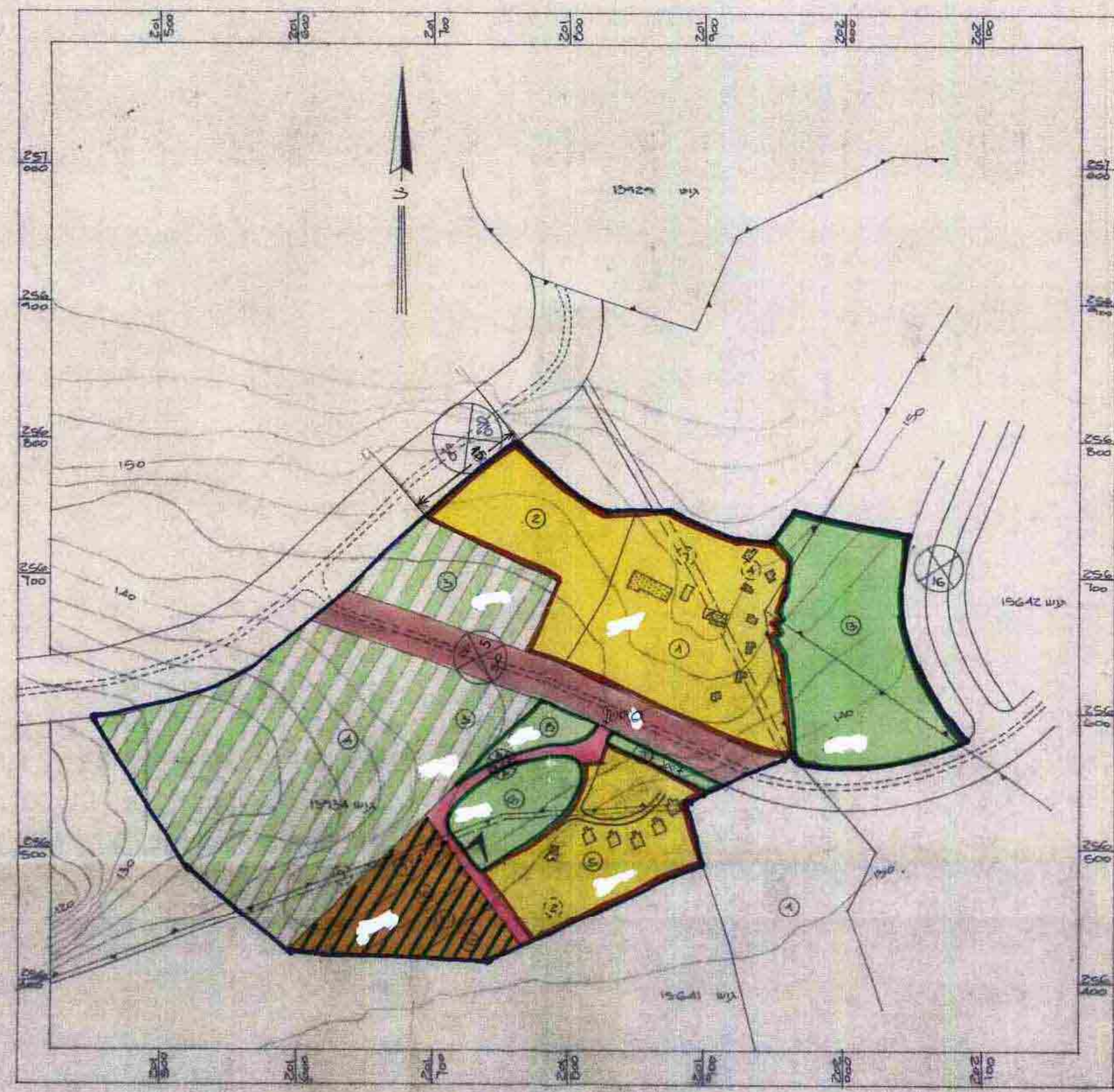
תכנית מפורטת 1:2500