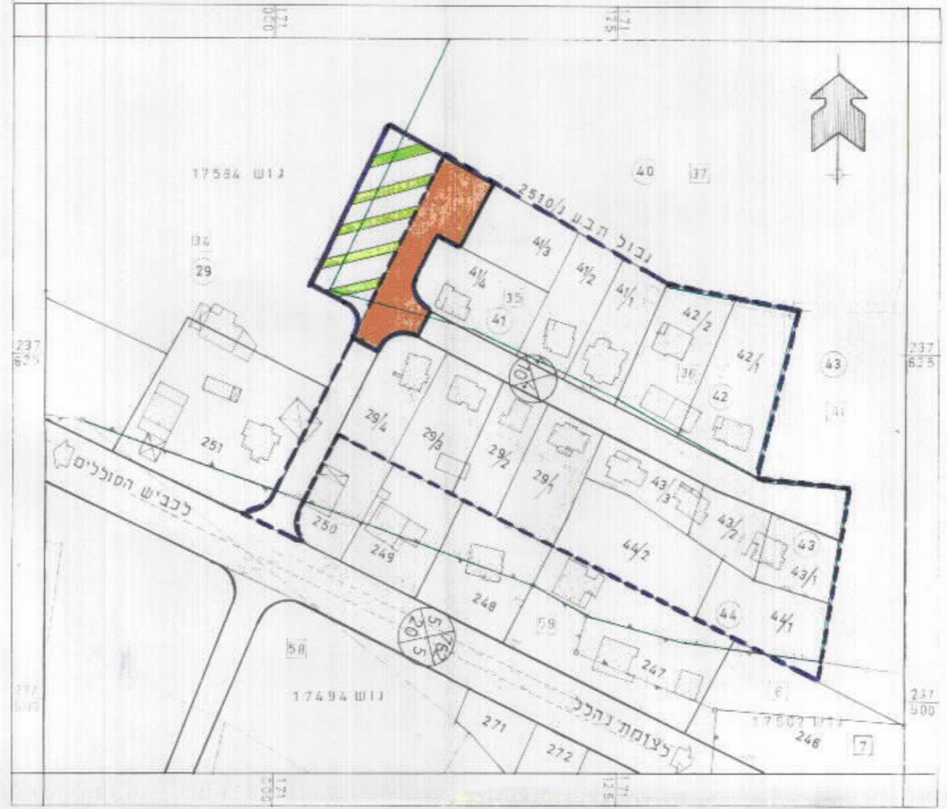
מצב קיים ק.מ. 1/1250