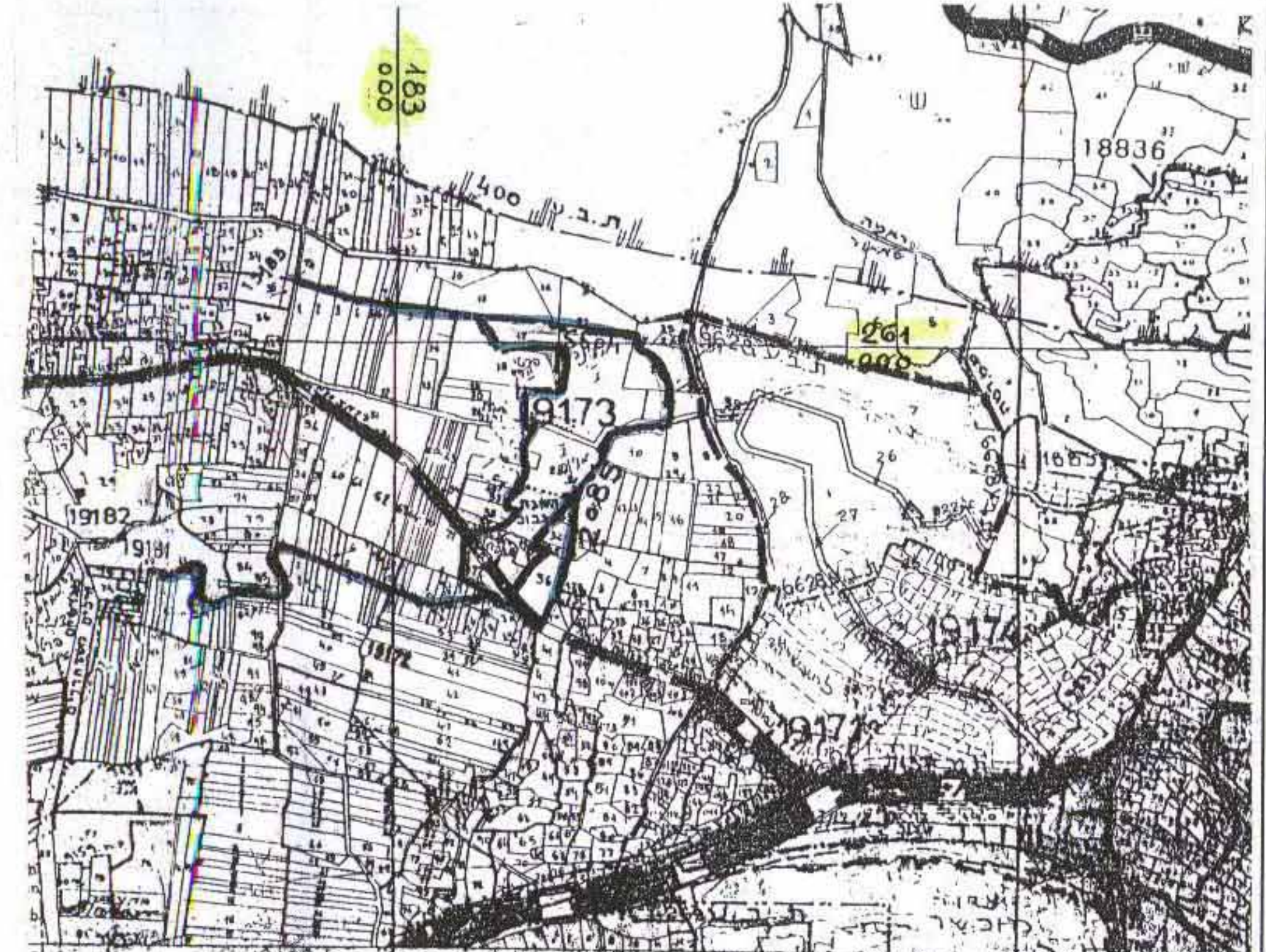
תרשים סביבה קני"מ 1:10000