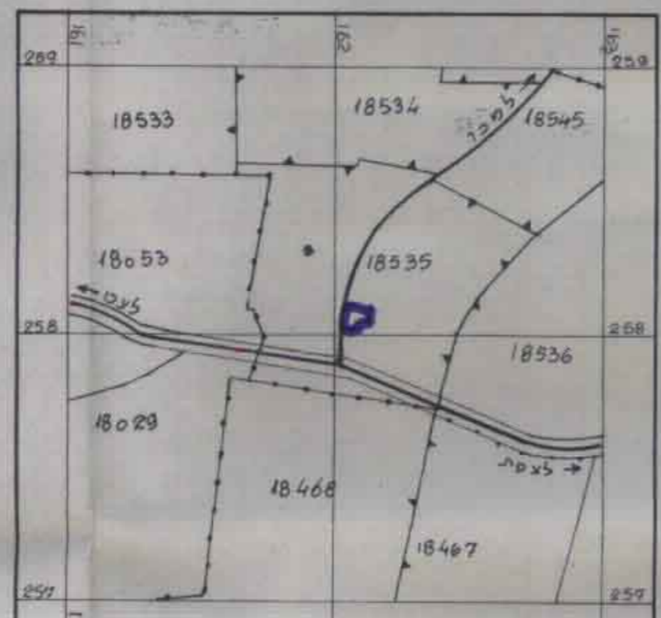
מפב חדש 1:1250