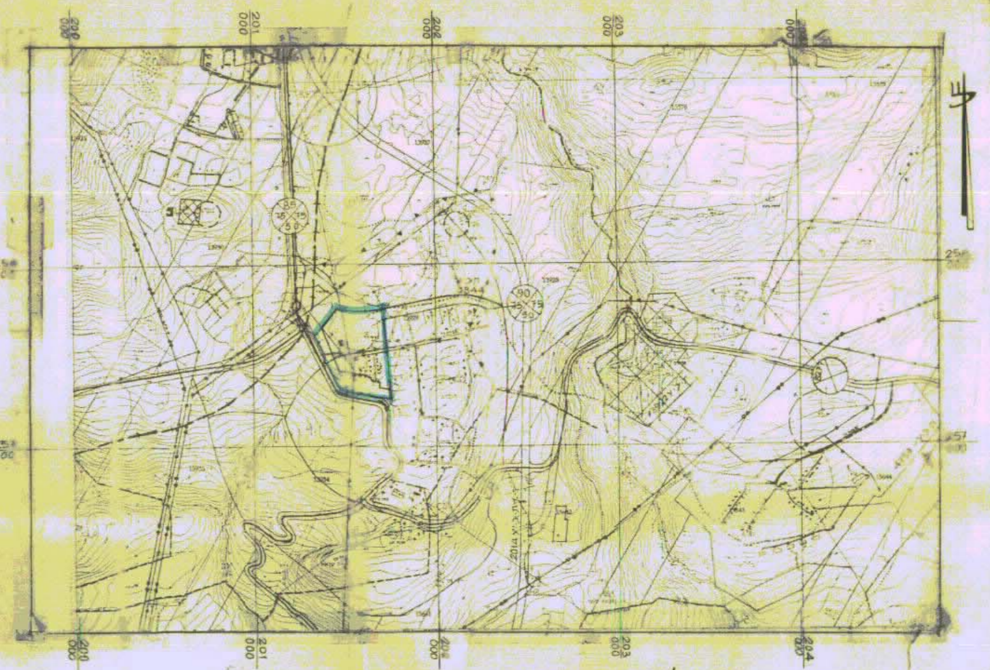
תעשים סגורה ק"מ - 1:20,000 ג-7051