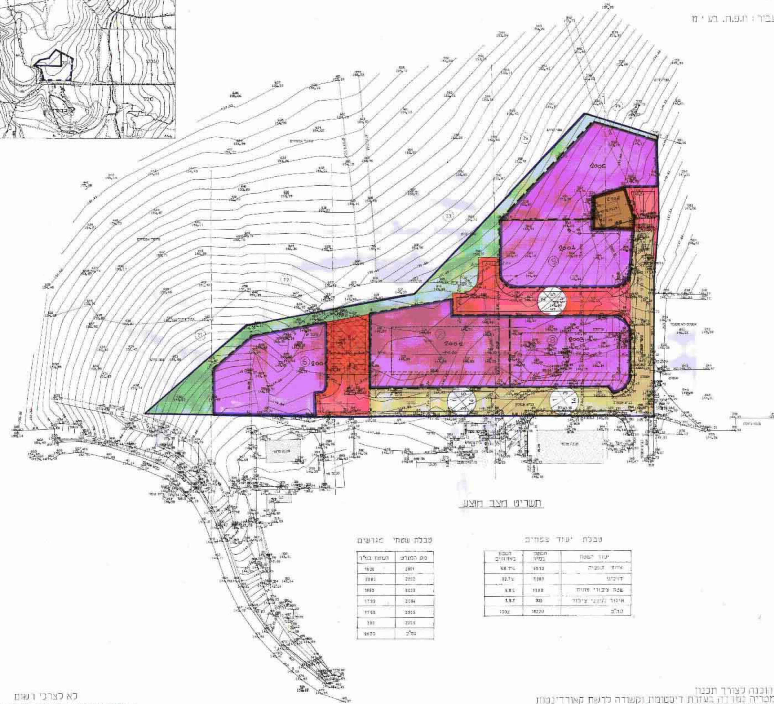
תשריט מצב חיצוני