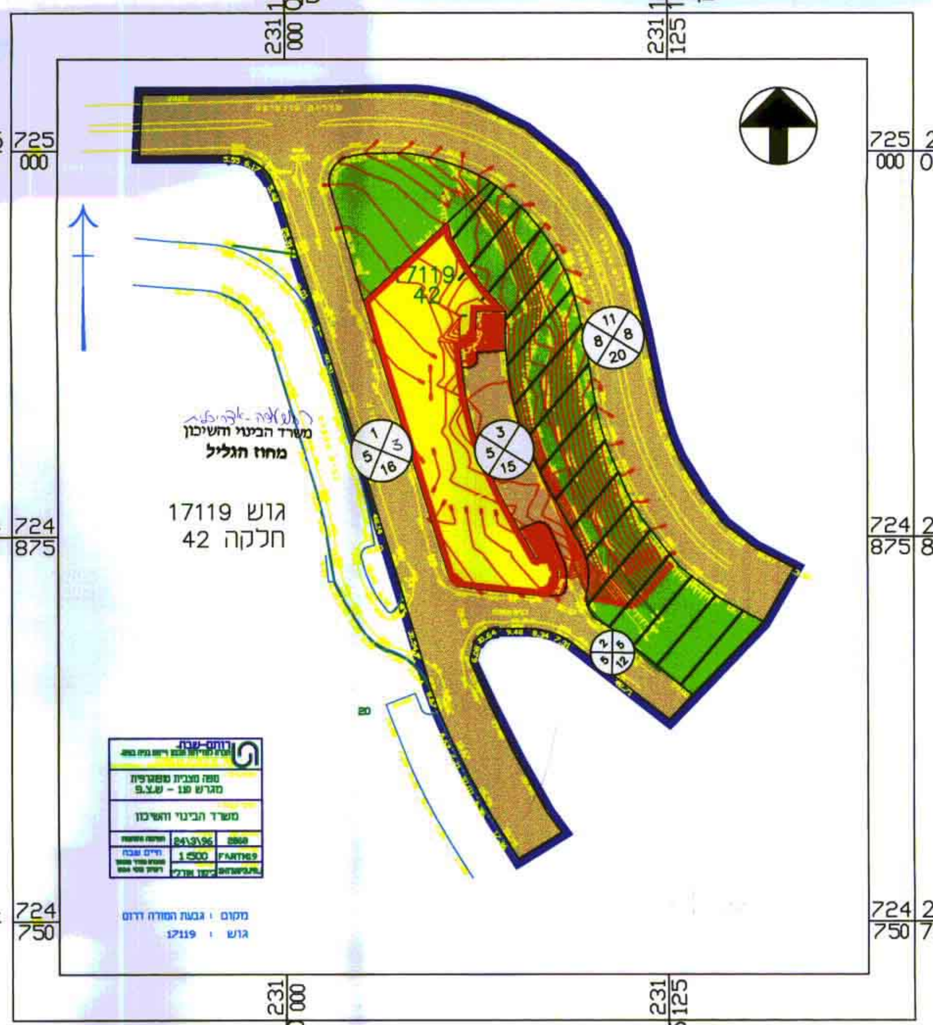
מצב מוצע בקנה מידה 1 : 1250