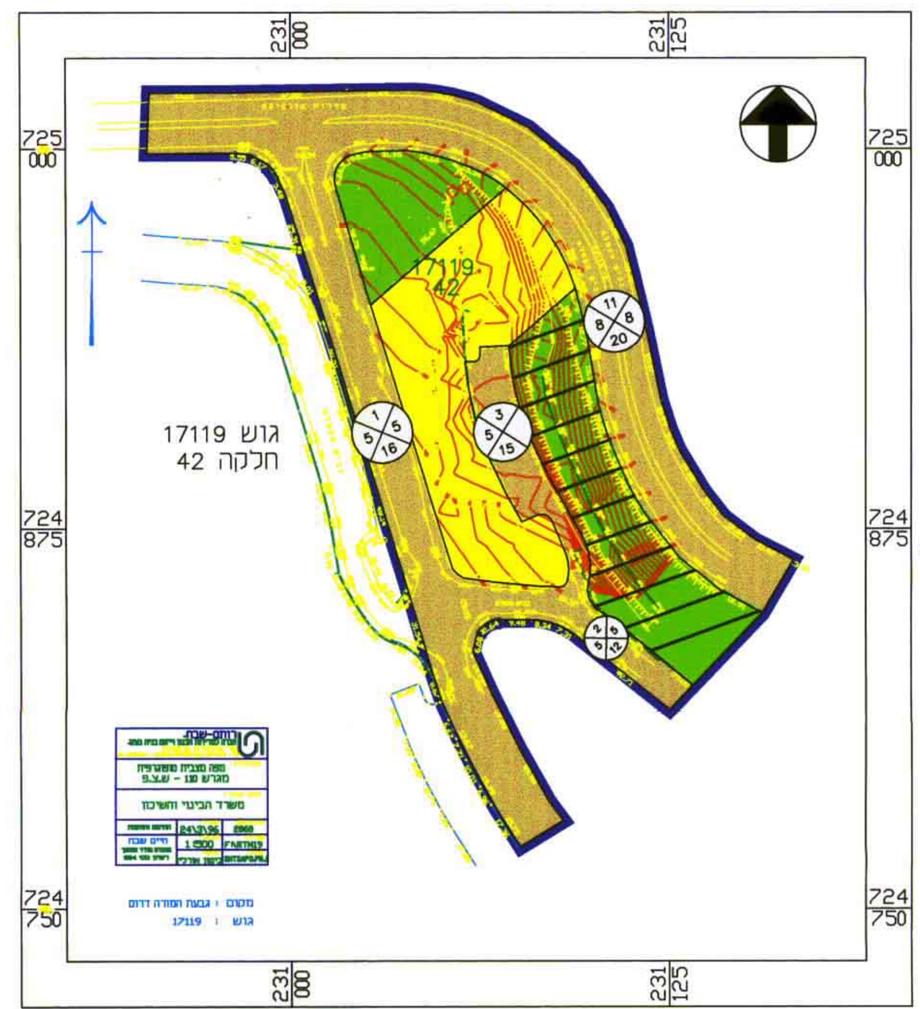
מצב קיים בקנה מידה 1 : 1250

תאריך : המקום : עפולה תחום שיפוט : עיריית עפולה נפה : יזרעאל יוזם התכנית : משרד הבינוי והשיכון מחוז הגביב טל: 06-6563093; 06-6574510 עורך התכנית : משרד הבינוי והשיכון מחוז הגביב בעל הקרקע : מינהל מקרקעי ישראל ת.ד. 580 צורת עלית שטח התכנית : 21.385 דונם מס' הגוש : 17119 חלק מחלקה : 42