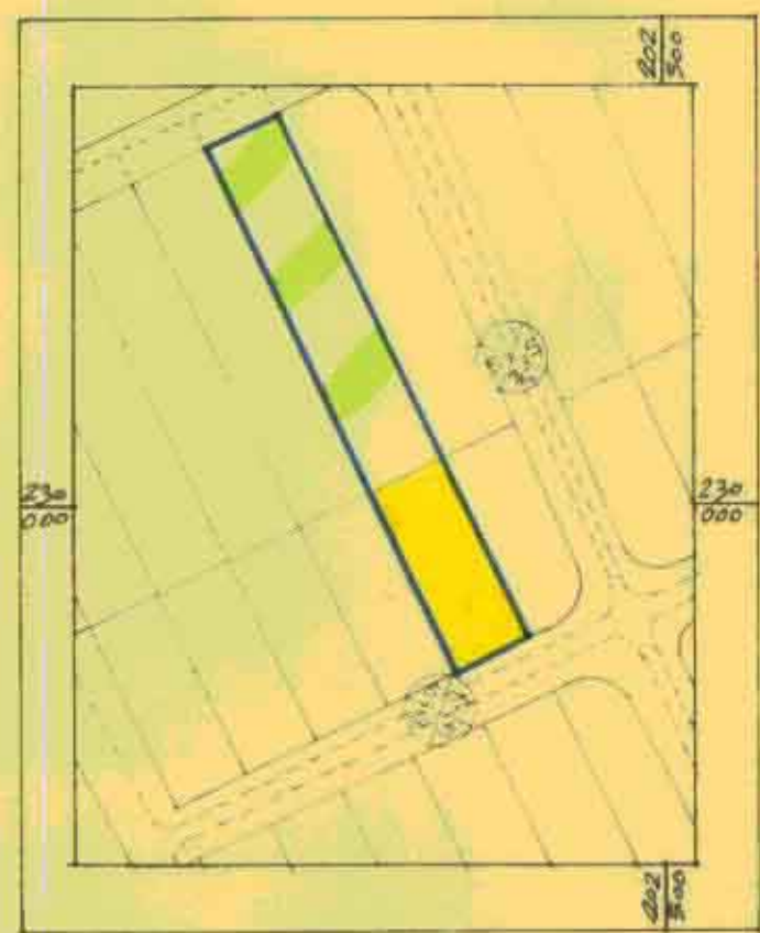
תכנית מצב ק"מ 1:2500