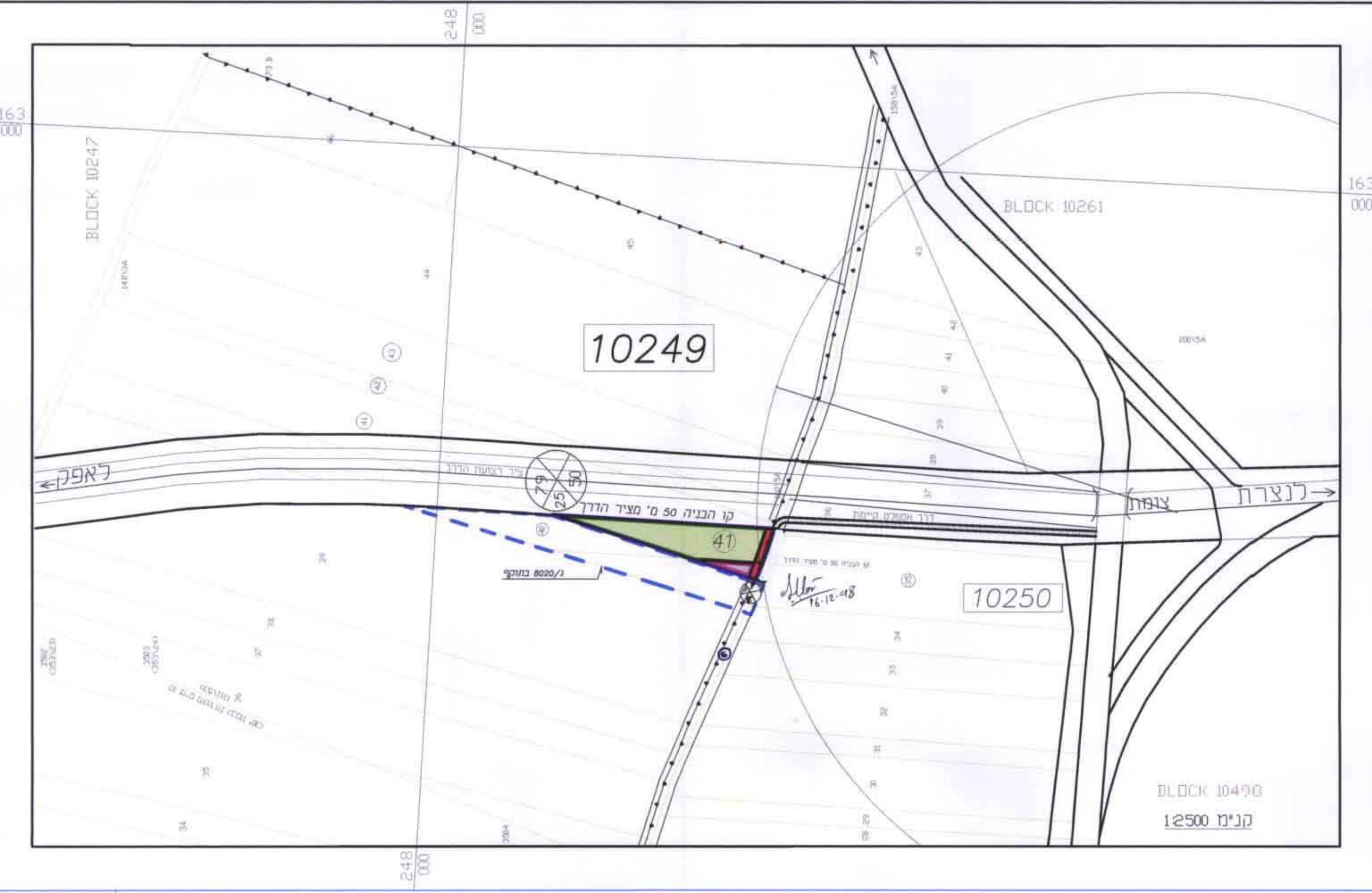
תכנית מצב מוצע ק.מ. 2500 : 1

תכנית מתבססת על מפה של אינג' יוסף מהנא מהנדס ומודד מוסמך שפרעם, רישיון מס' 36256, מל: 9868943