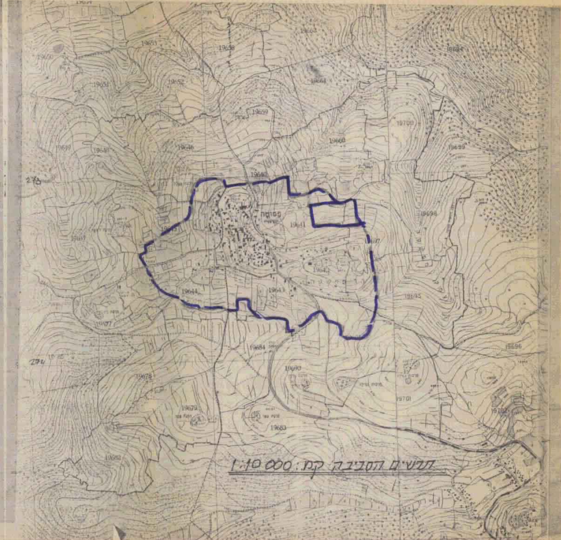
מעשים הסביבה ק"מ: 1:10,000