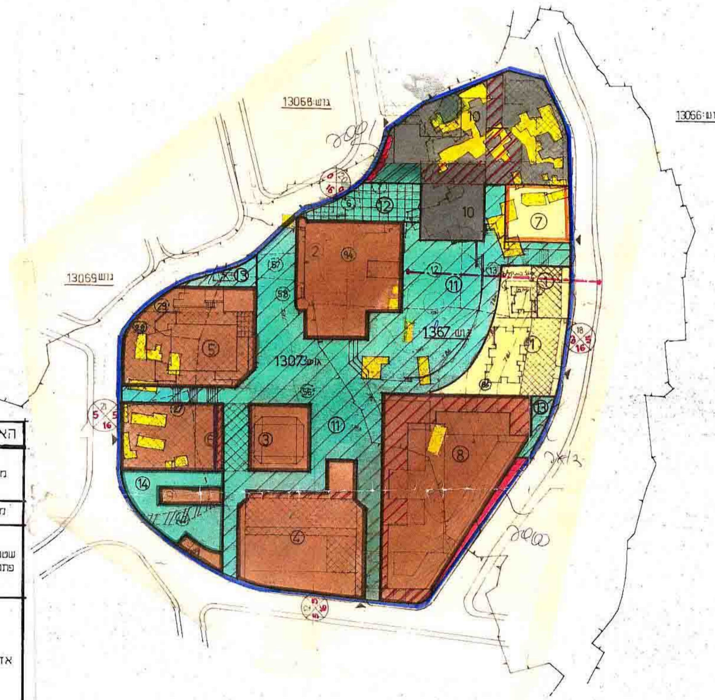
תשריט 1:1250 ק.מ.