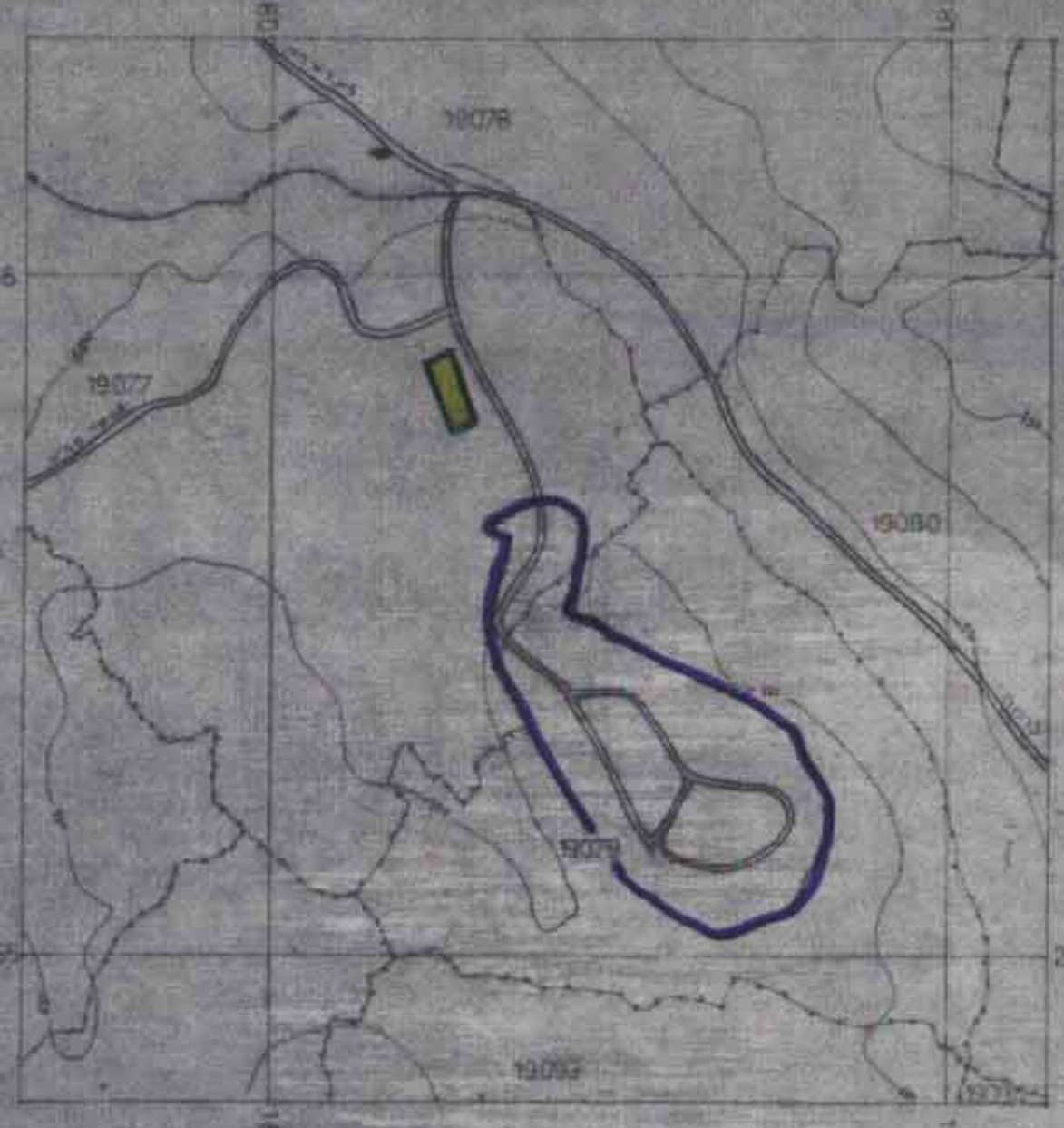
תורשים הסביבה 1:10000