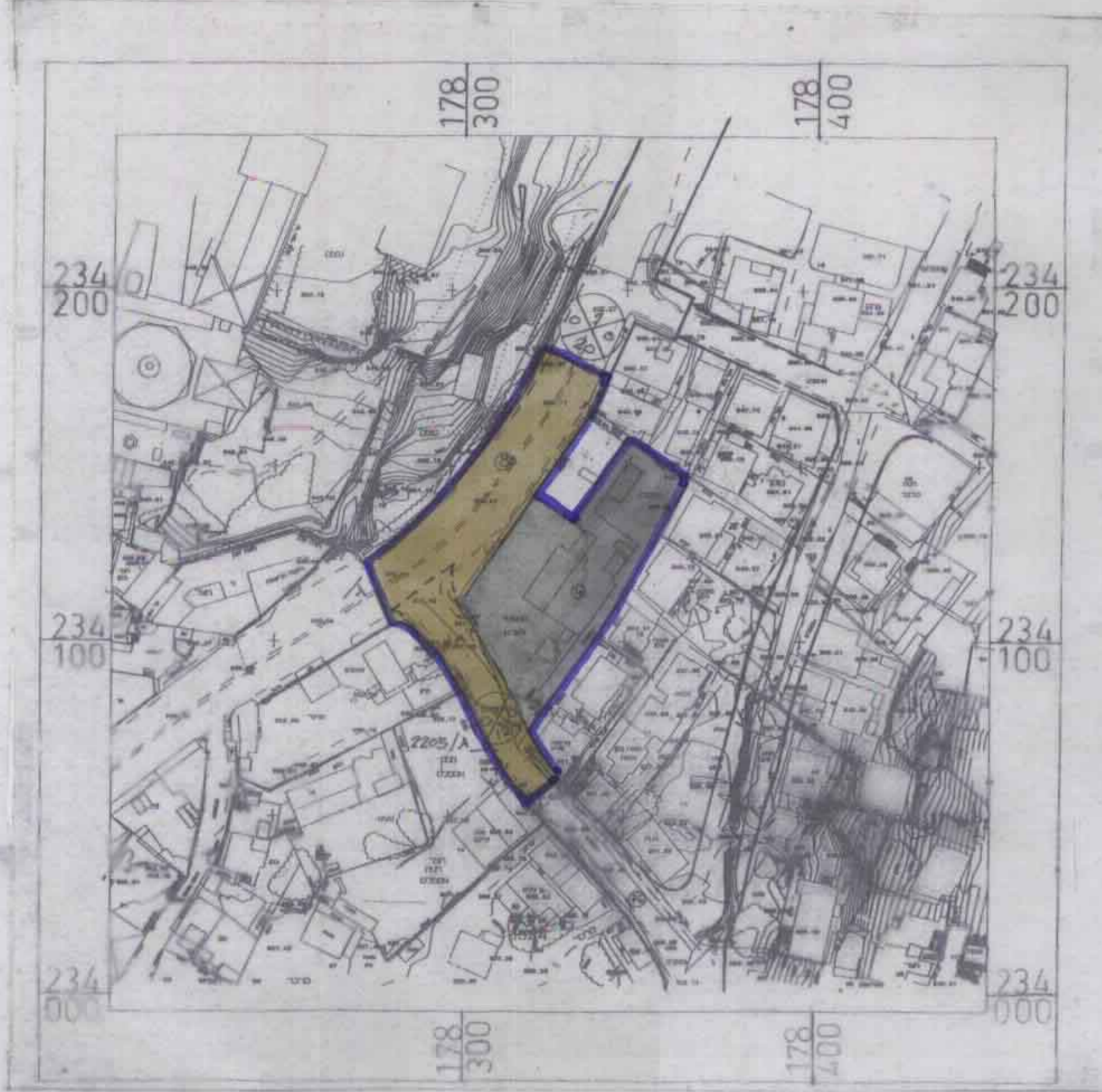
תכנית מצב קיים קנ"מ 1:1250