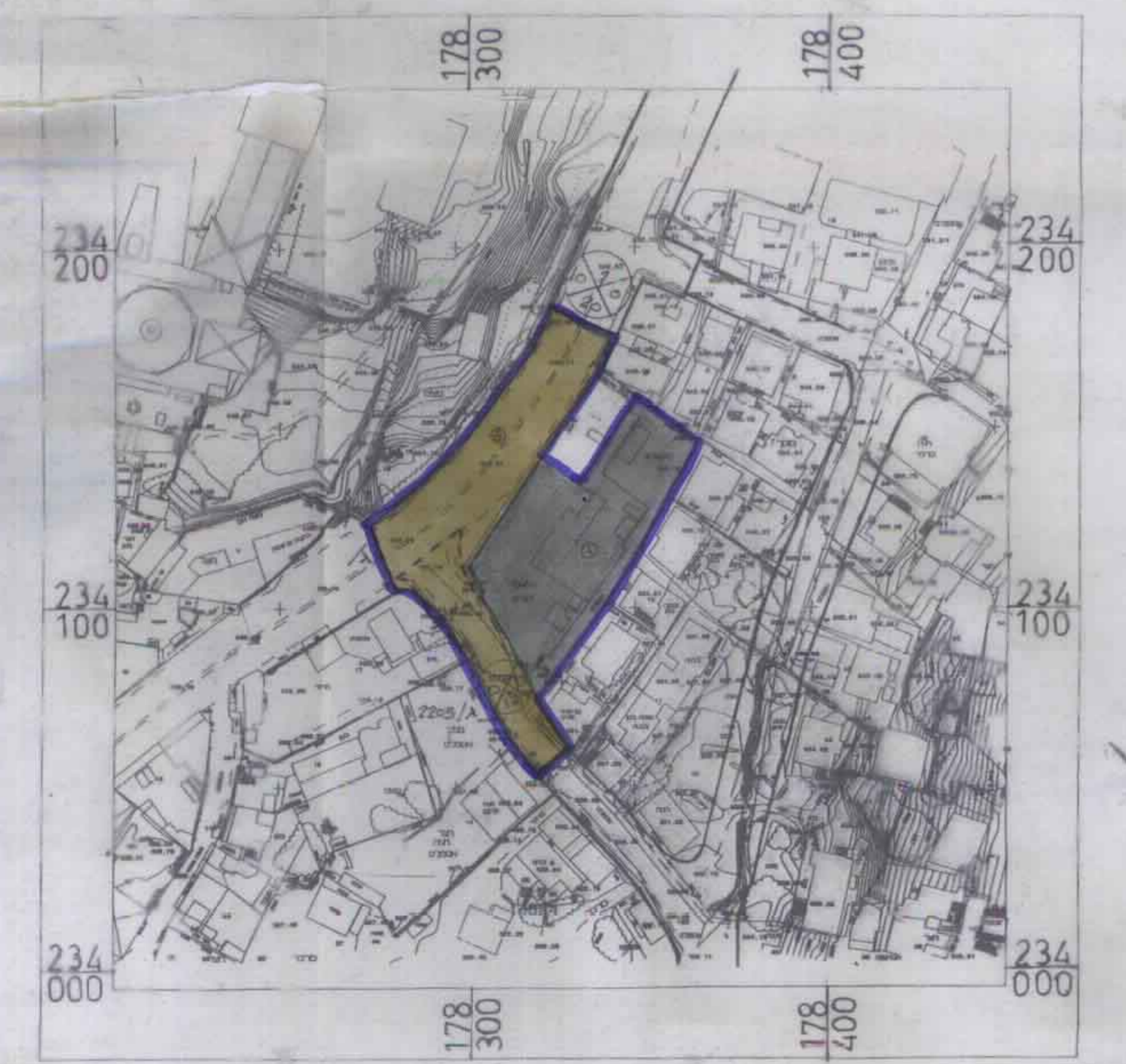
תכנית מצב מוצע קנ"מ 1:1250