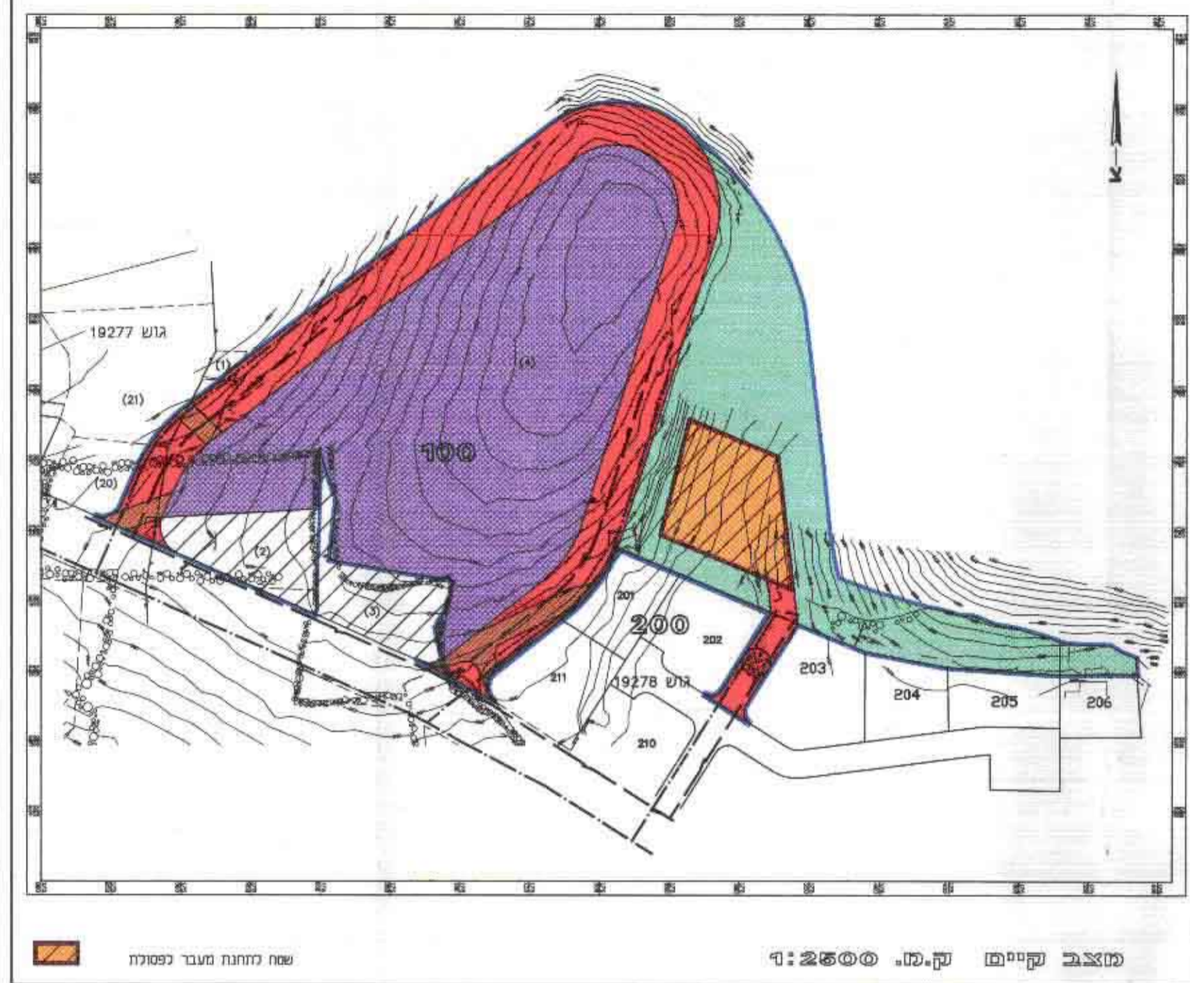
ממצב קיימת ק.מ. 1:2500

חתימות בעל הקרקע : מ.א. משגב מגיש התכנית : מ.א. משגב המתכנן : הרי ברנד אדריכלים ומתכנני ערים (1994) בע"מ