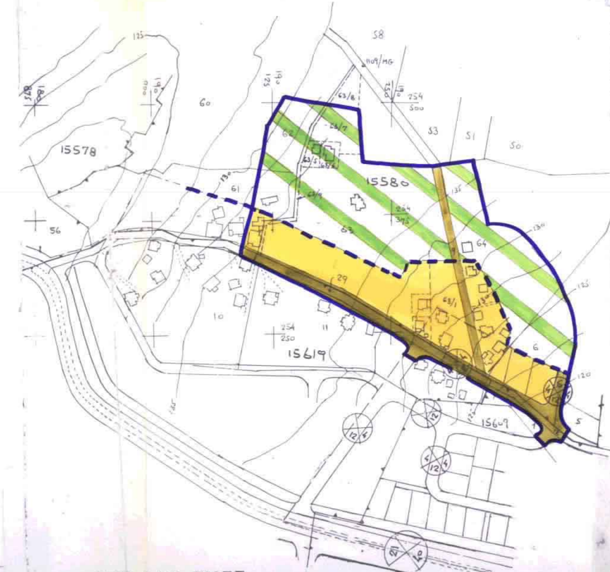
תכנית מצב קיים ק"מ. 1:2500