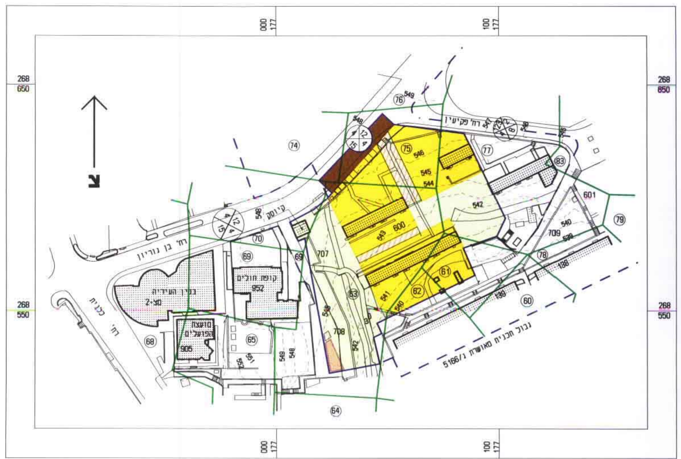
תרשים מצב קיים 1:1000 תכנית ג/5166, תרש"צ 2/53/5